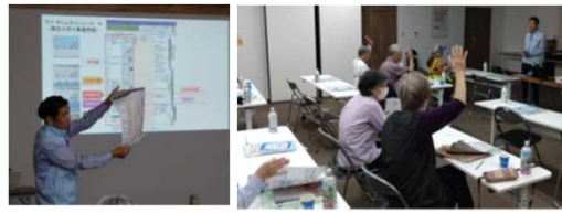
志築河川レンジャーからの説明状況