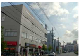
尼崎市 東園田町総合会館 (3階ホール)