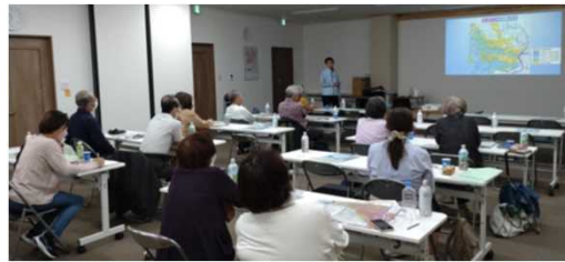
過去の水害・災害について学習