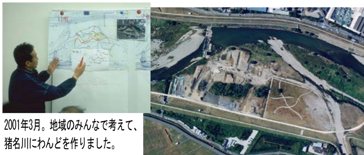
2001年3月。地域のみんで考えて、猪名川にわんどを作りました。