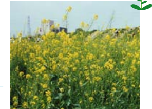
セイヨウカラシナ

春、河川敷に黄色く咲いている菜の花です。種は粒(つぶ)マスタードのカラシの原料になります。どんな味がするかな?