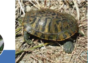
ミシシッピーアカミミガメ

わんどで一番多く見つかるといわれるカメです。“ミドリガメ”として飼われていたものが逃げ出したり、放されたりして野生化しました。性格は凶暴で、噛まれないよう注意が必要です。