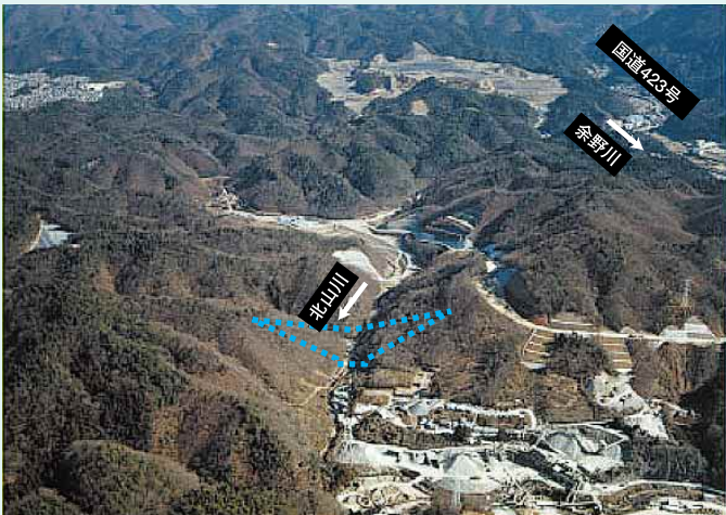
.....ダムのイメージです