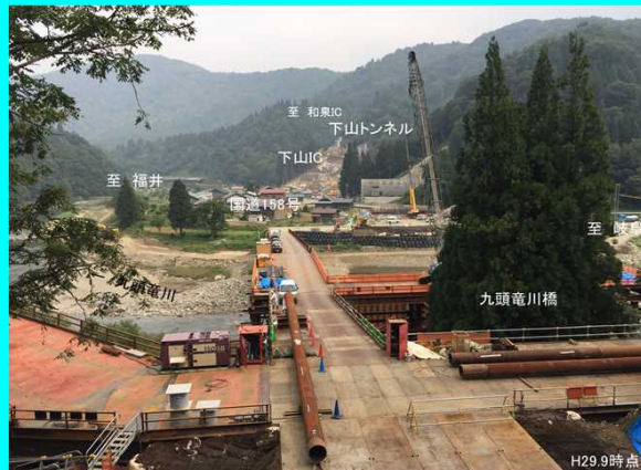
橋梁・改良工事が進む下山IC予定地付近