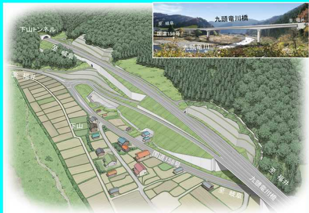
下山IC完成イメージ図