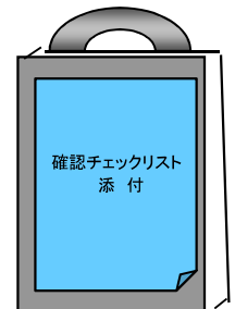
【申請書・添付書類】