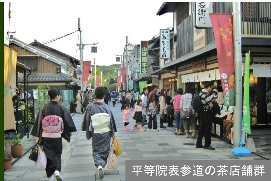
平等院表参道の茶店舗群