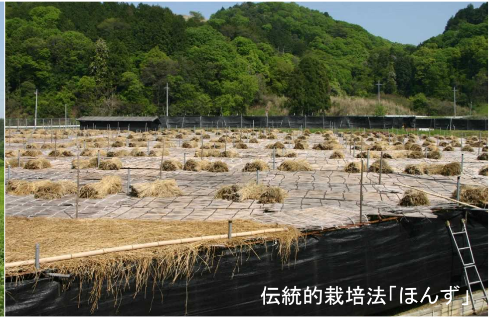
伝統的栽培法「ほんず」