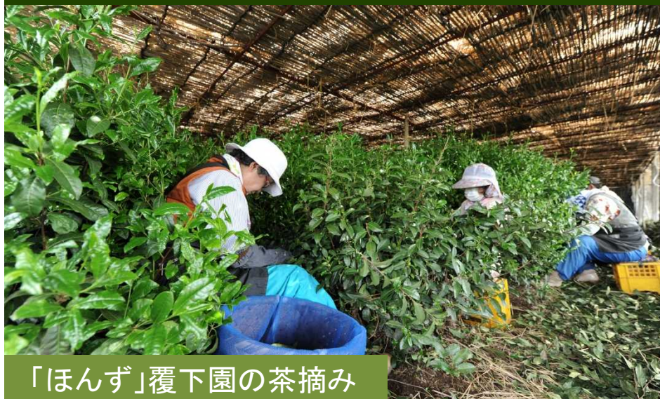
「ほんず」覆下園の茶摘み

宇治川の自然景観を骨格とし、重層的に発展した市街地とその周辺に点在する茶園によって構成される茶業に関する独特の文化的景観