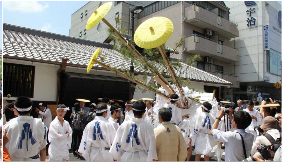
市指定 無形民俗文化財 太幣神事への助成