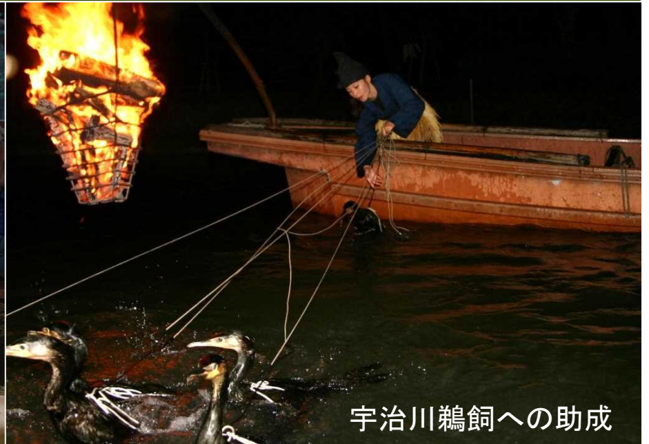
宇治川鶉飼への助成