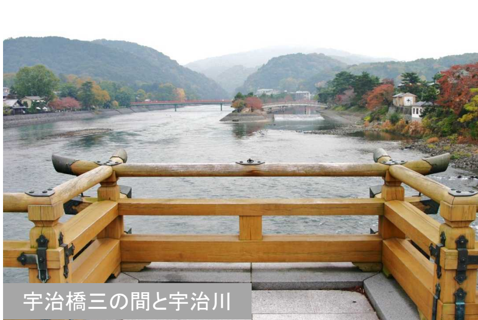
宇治橋三の間と宇治川