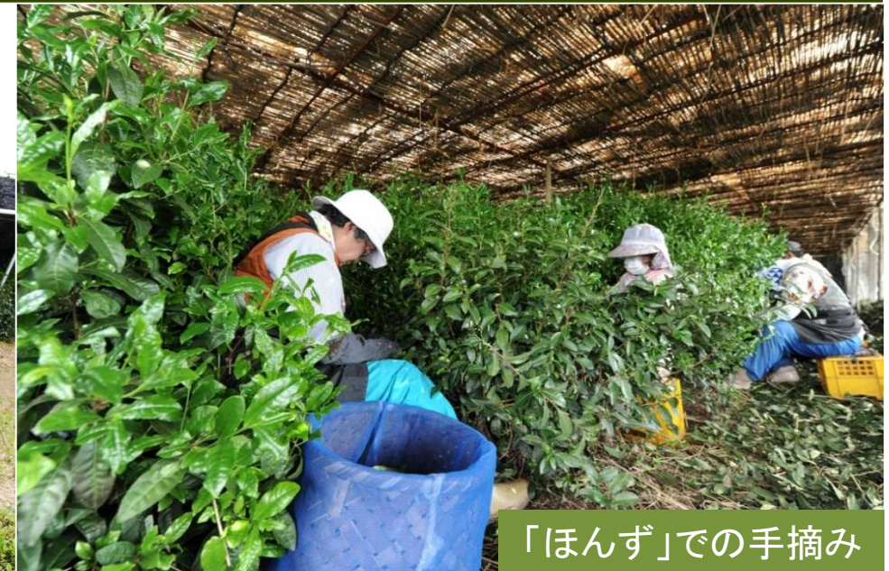
「ほんず」での手摘み