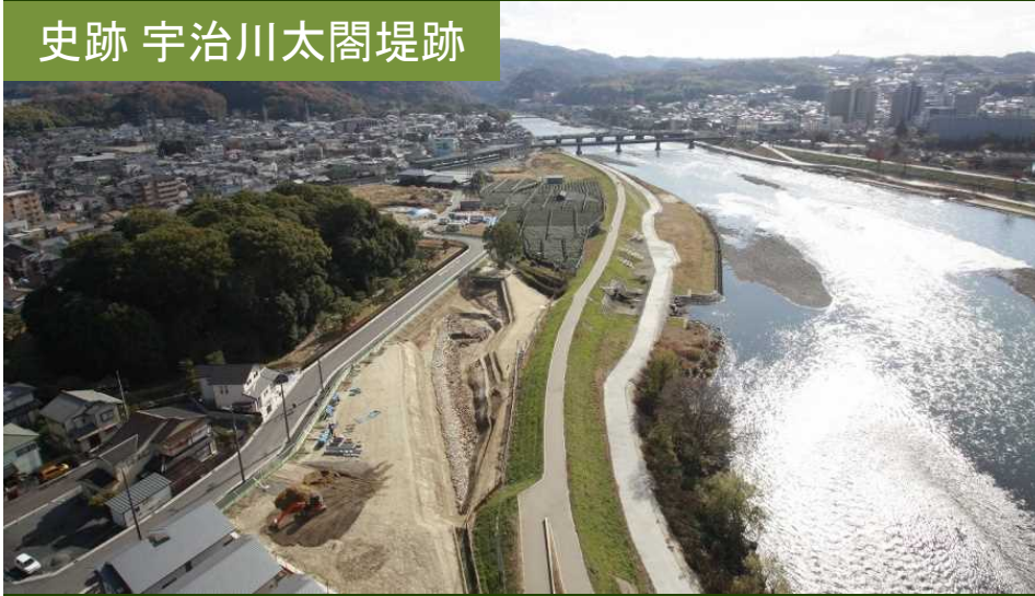
史跡 宇治川太閤堤跡

16世紀末、秀吉の伏見城築城を契機とした淀川水系の治水・交通に関する施策と土木技術を示し、極めて良好な状況に保存された遺跡。