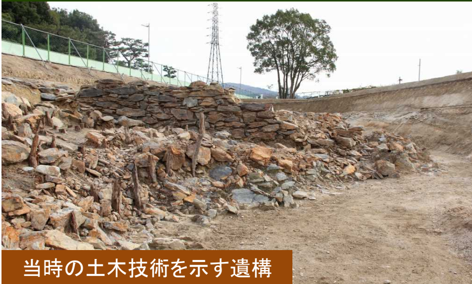
当時の土木技術を示す遺構