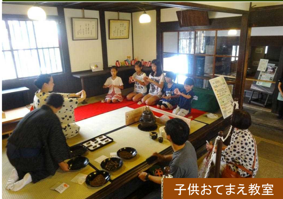
子供おてまえ教室