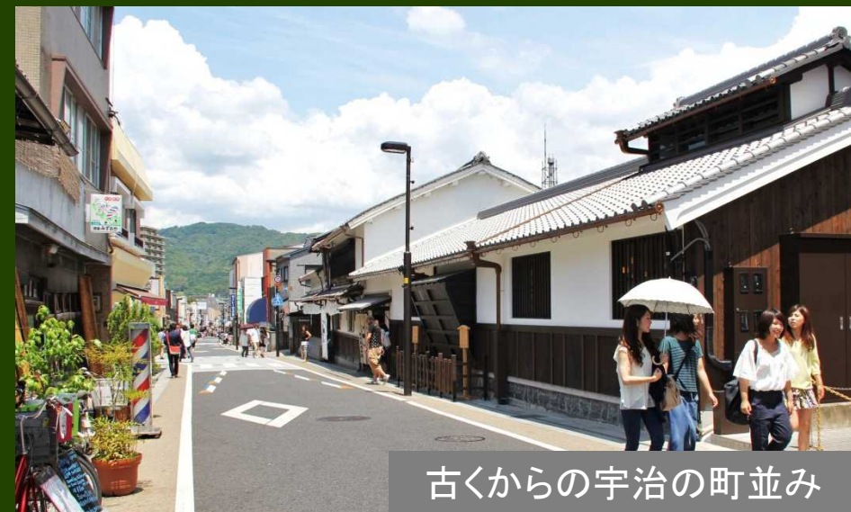
古くからの宇治の町並み