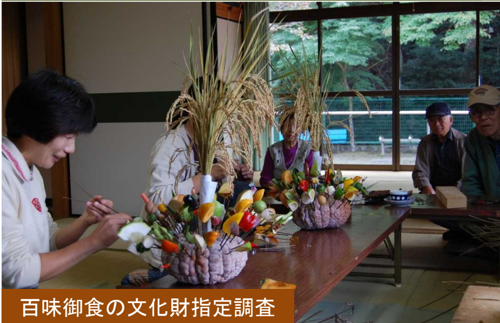
百味御食の文化財指定調査