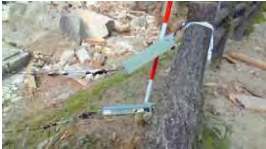
熊野ワイヤーセンサー