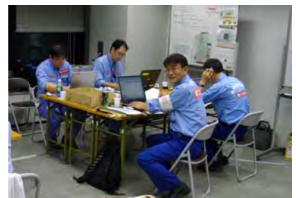
奈良 TEC-FORCE 司令部での活動状況