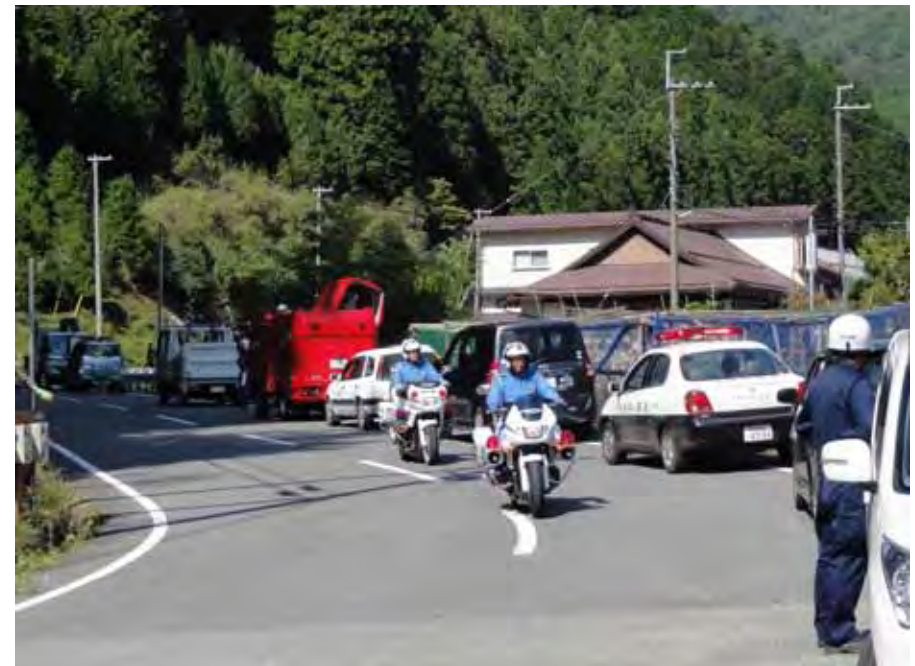
警戒区域内を巡視する白バイ