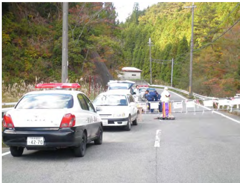
警戒区域内における監視