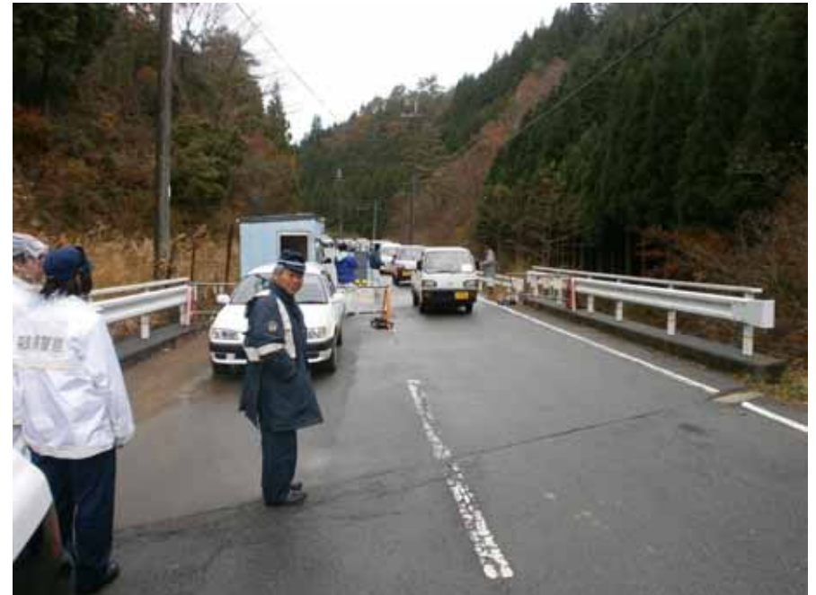
警戒区域内における監視