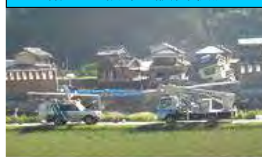
〔輪中堤の復旧工事状況を送信(高岡)〕