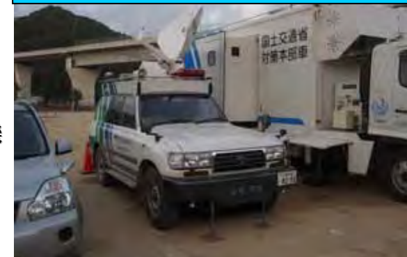
〔災害対策本部(那智勝浦町)〕

那智勝浦町の現地災害対策本部の運営を支援するため、通信機能を有する災害対策本部車を派遣