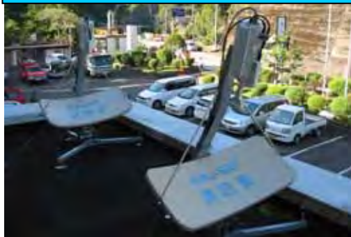
〔空中線設置状況(十津川村)〕