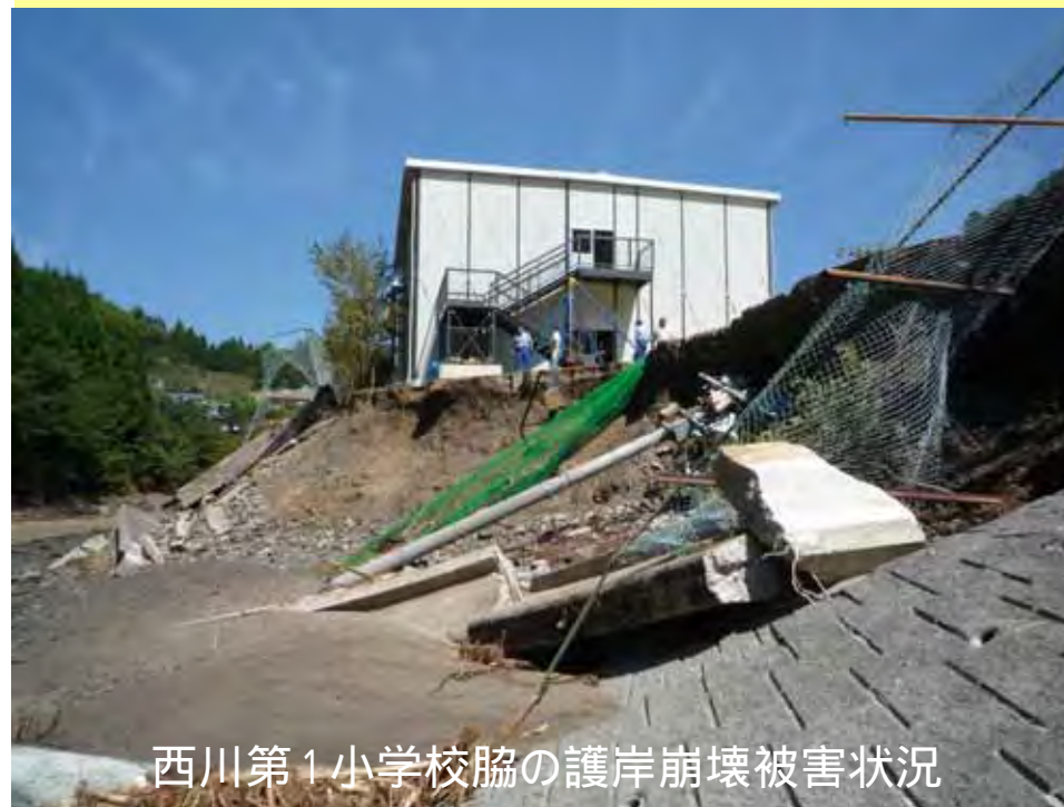
西川第1小学校脇の護岸崩壊被害状況