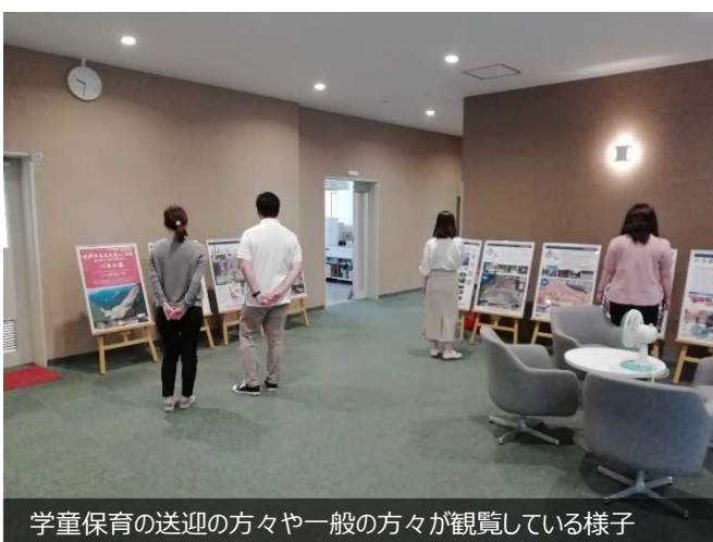
学童保育の送迎の方々や一般の方々が観覧している様子