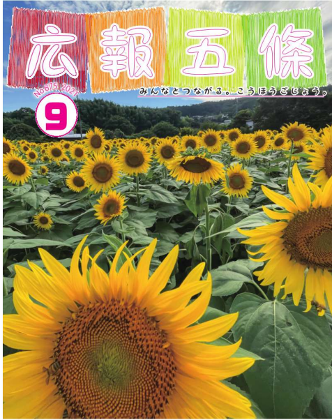
写真：上野町のひまわり園 五條市の夏の風物詩である上野町のひまわり園を2年ぶりに開園。今年は市内5つの障害者就労支援施設に委託し、ひまわりを育ててもらいました。7月下旬から収穫し、8月中旬まで見ごこけが良かったひまわり園の様子を、ドローンで空撮し、五條市YouTubeで動画を公開しています。ぜひご覧ください。

奈良県五條市で発行している「広報五條」令和3年9月号に、紀伊山系砂防事務所がこれまで行ってきた対策工事の現状や今後の整備についての特集記事が掲載されました。