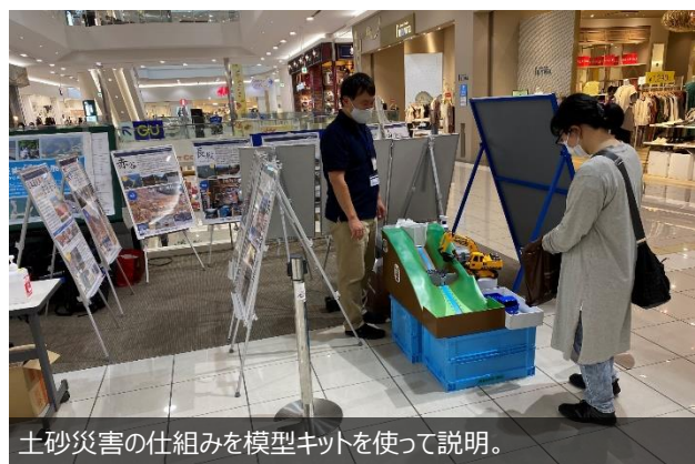
土砂災害の仕組みを模型キットを使って説明。