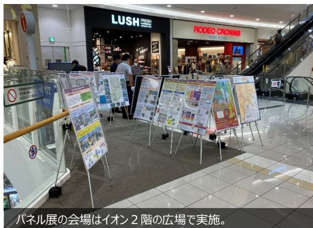
パネル展の会場はイオン2階の広場で実施。