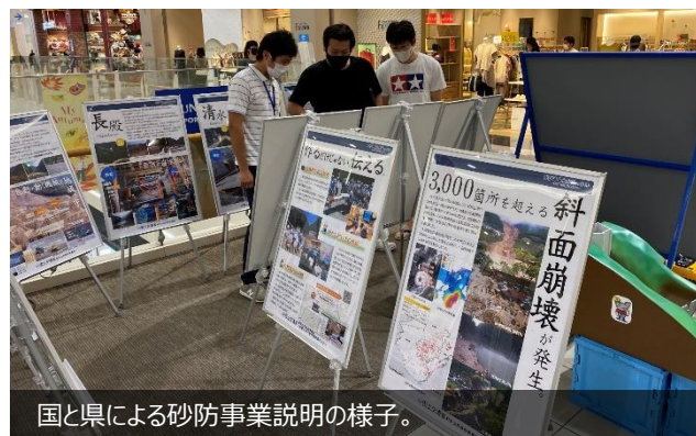
国と県による砂防事業説明の様子。