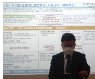
本局技術管理課 課長補佐による講演