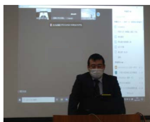
紀伊山系砂防事務所長による挨拶