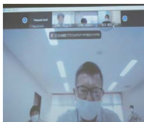
大和川河川事務所副所長 による閉会の挨拶