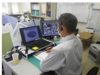
施工業者の受講状況