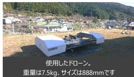
使用したドローン。 重量は7.5kg、サイズは888mmです

大規模土砂災害対策技術センターに近接する市野々小学校の皆さんに、ドローン基地から自動で飛び出し、事前に設定された飛行ルートに基づいて飛行して渓流や砂防施設の状況を撮影し、基地まで戻ってくるまでの様子を見学いただきました。また、ドローンに搭載されている360度カメラで撮影した動画を元に作成したVRも体験いただきました。