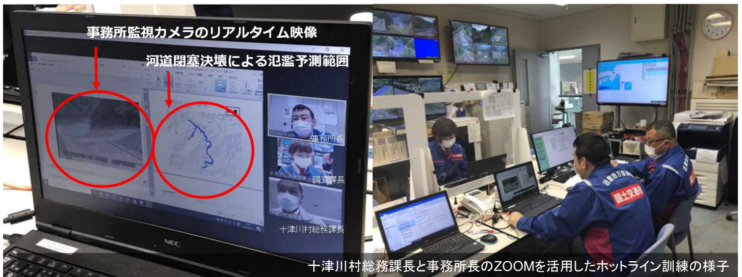
十津川村総務課長と事務所長のZOOMを活用したホットライン訓練の様子