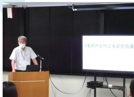
紀伊山系砂防事務所 小原副所長