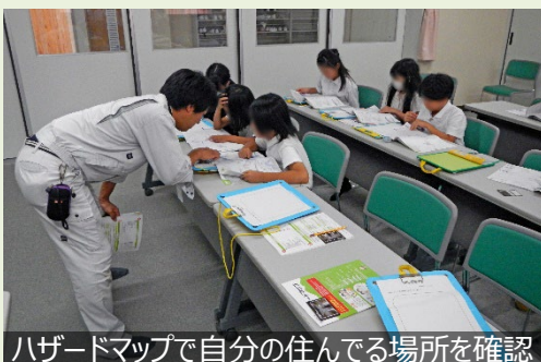
ハザードマップで自分の住んでる場所を確認