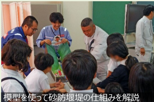
模型を使って砂防堰堤の仕組みを解説