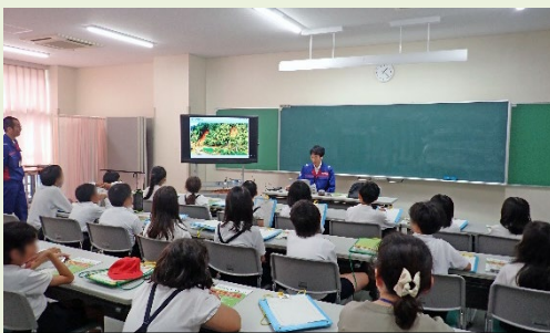
映像を用いた土砂災害についての授業