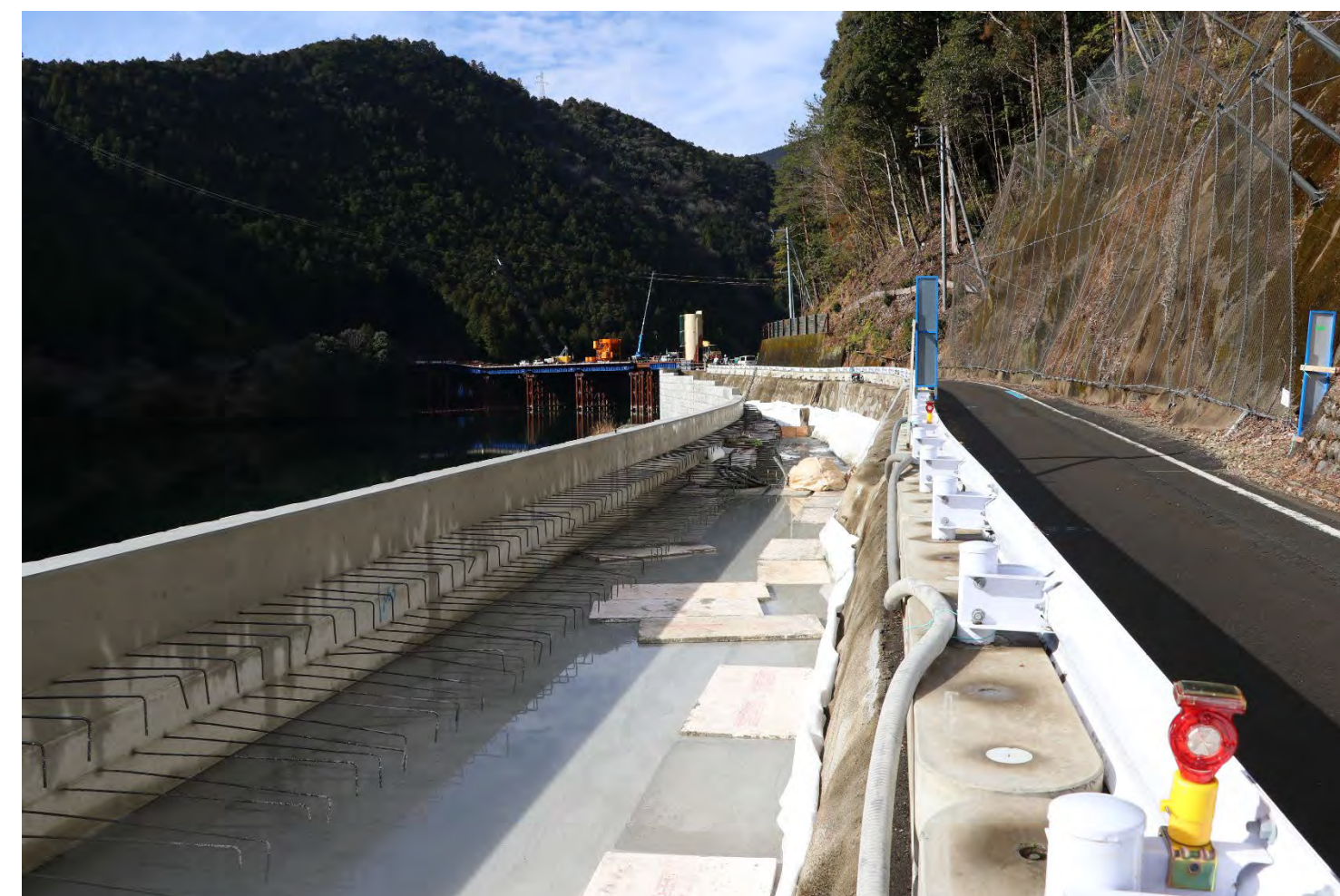
② 下尾井北地区他改良工事