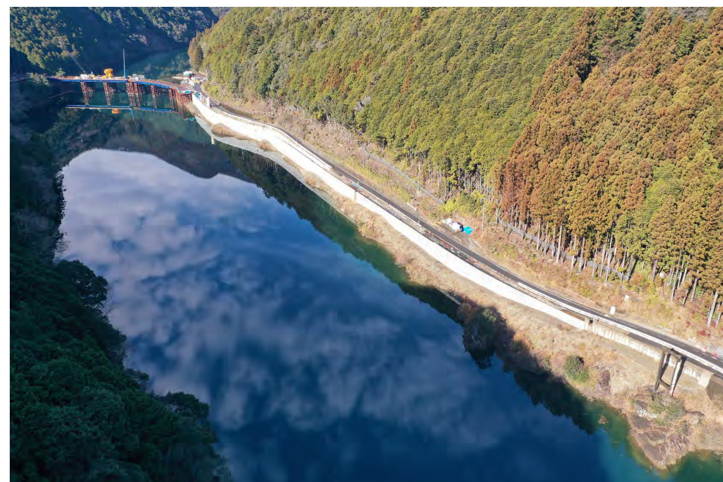
① 起点側より下尾井北地区他改良方面を望む