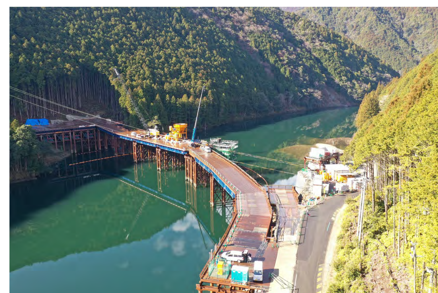
⑤ 1号トンネル他工事