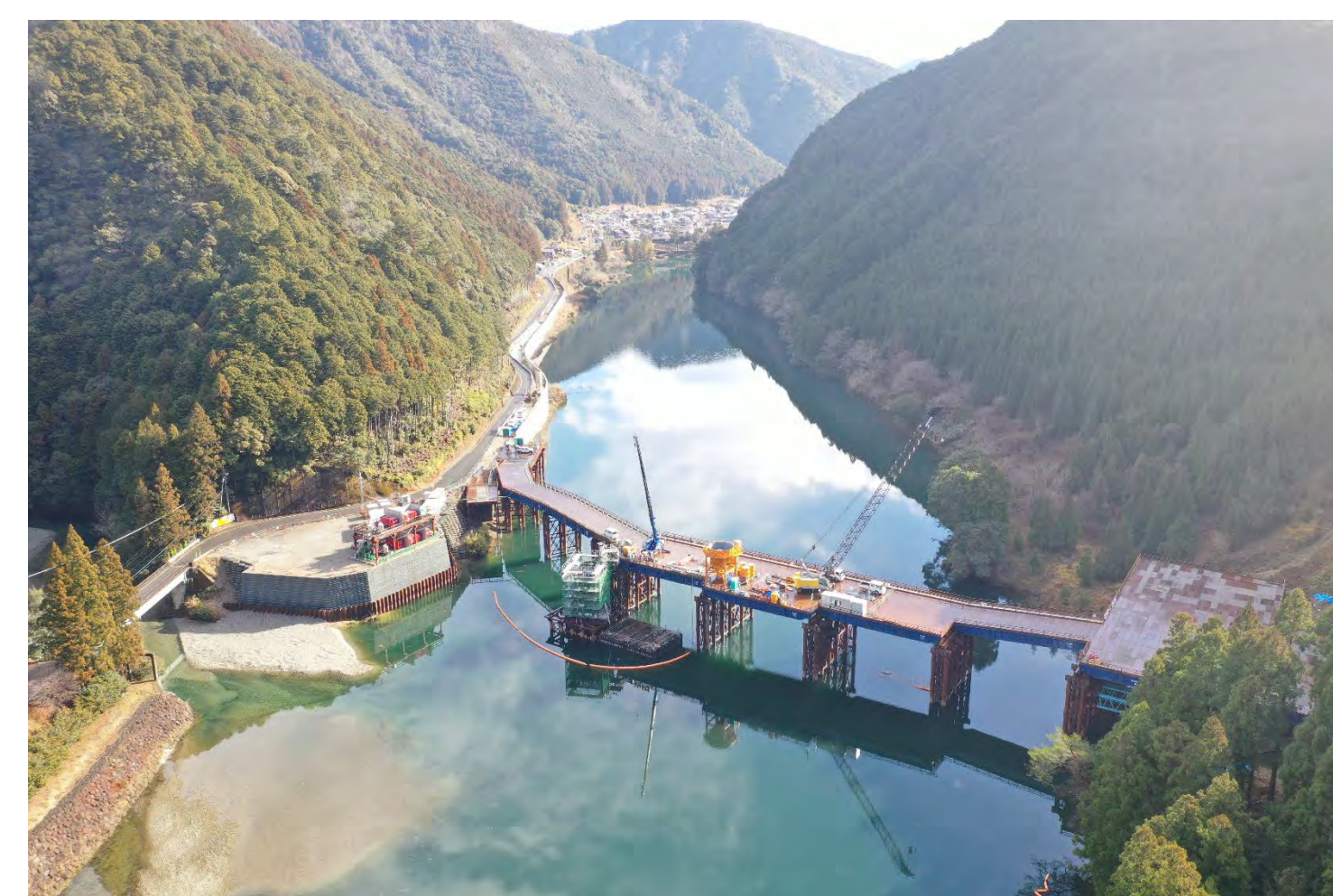
⑥ 1号トンネル他工事