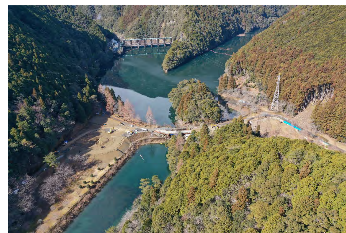
⑦ 2号トンネル他工事