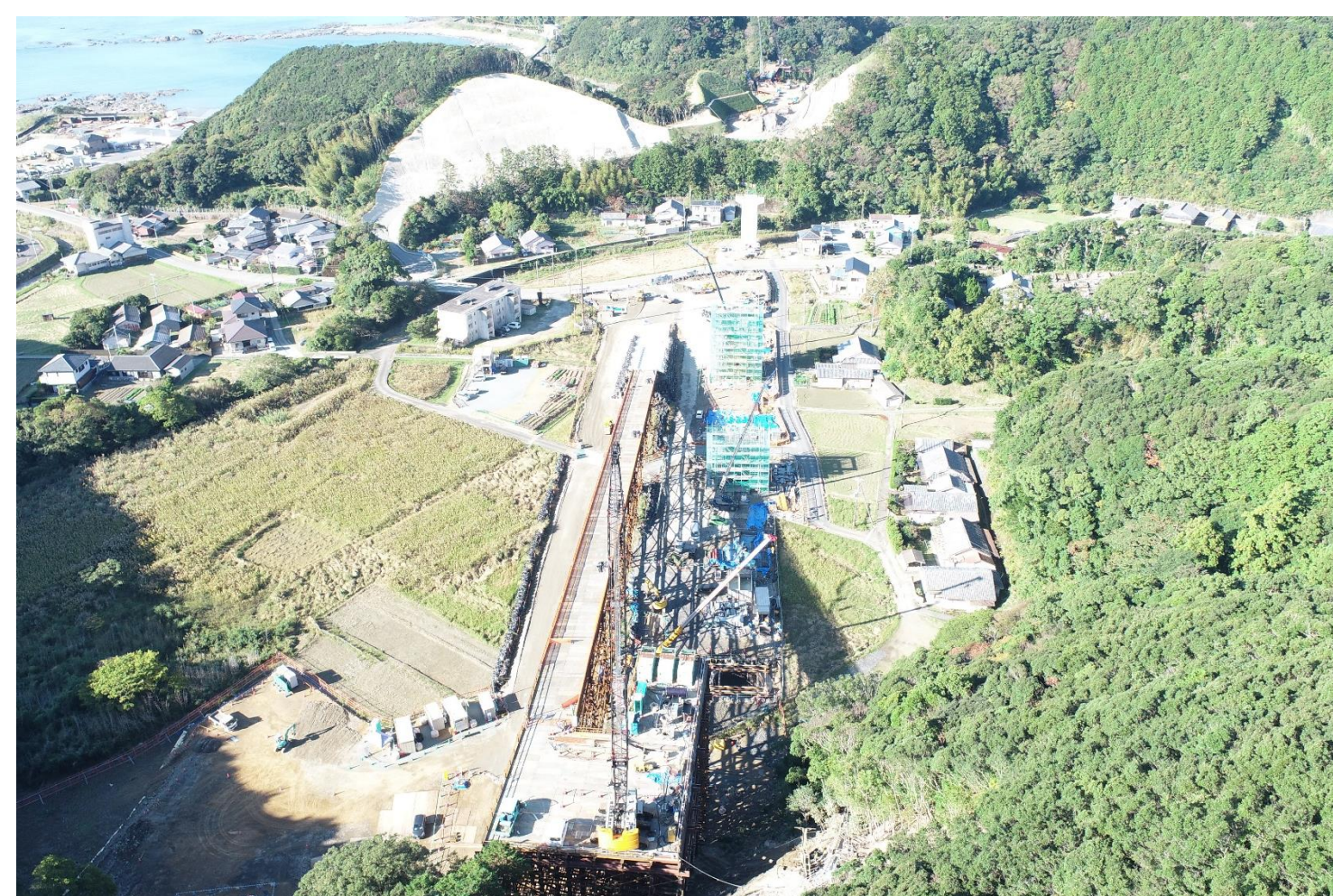
⑥ 高富川橋下部工事