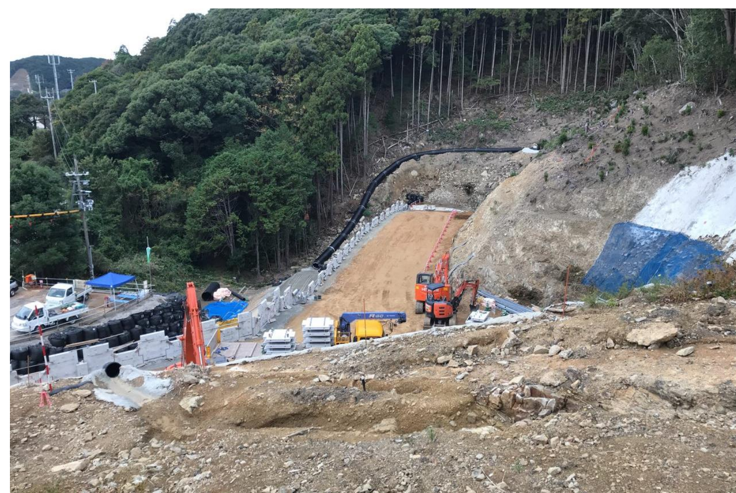
① 江住第二トンネル他工事