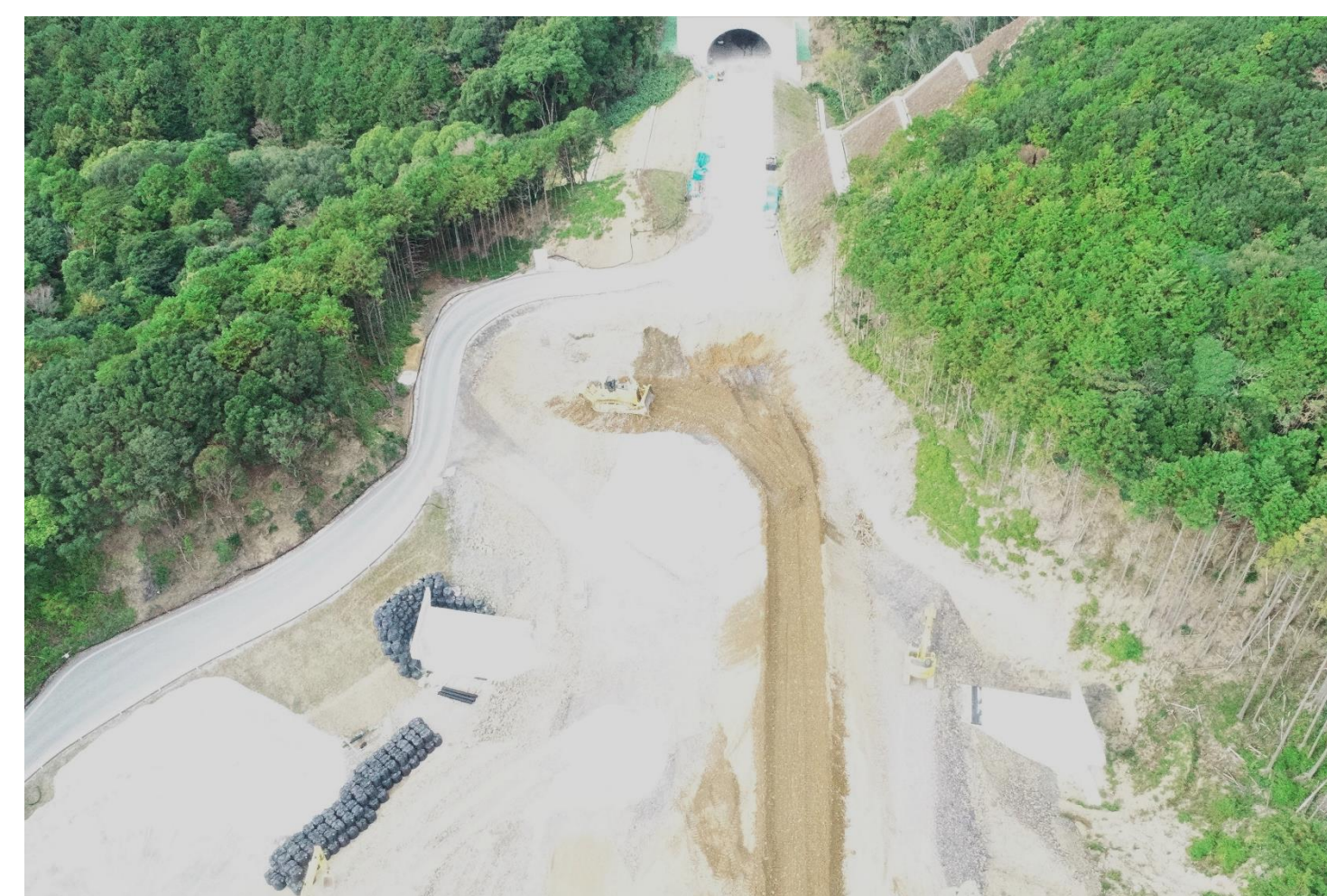
⑦ 二色トンネル工事(令和2年4月10日貫通)