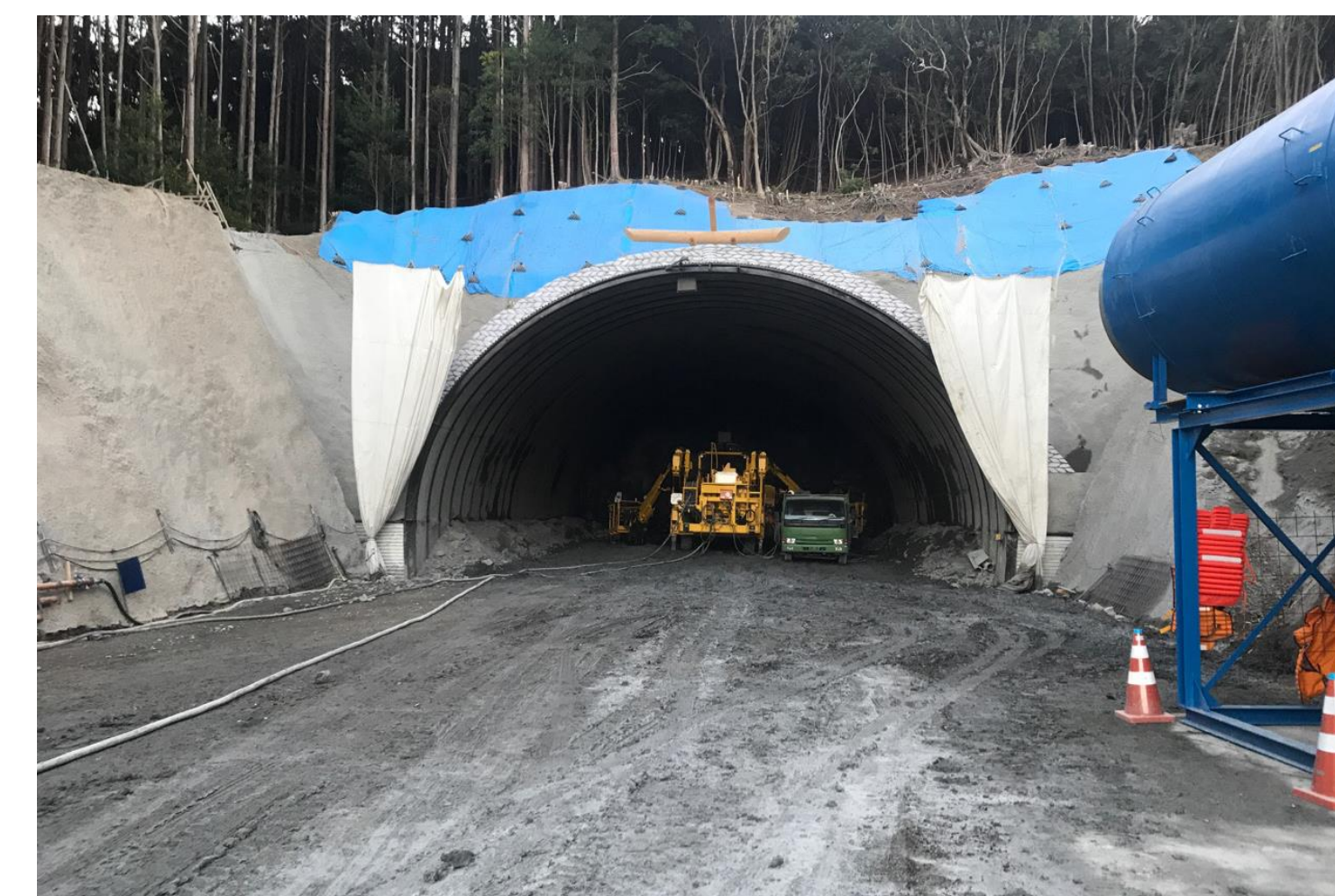
④ 田子トンネル他工事