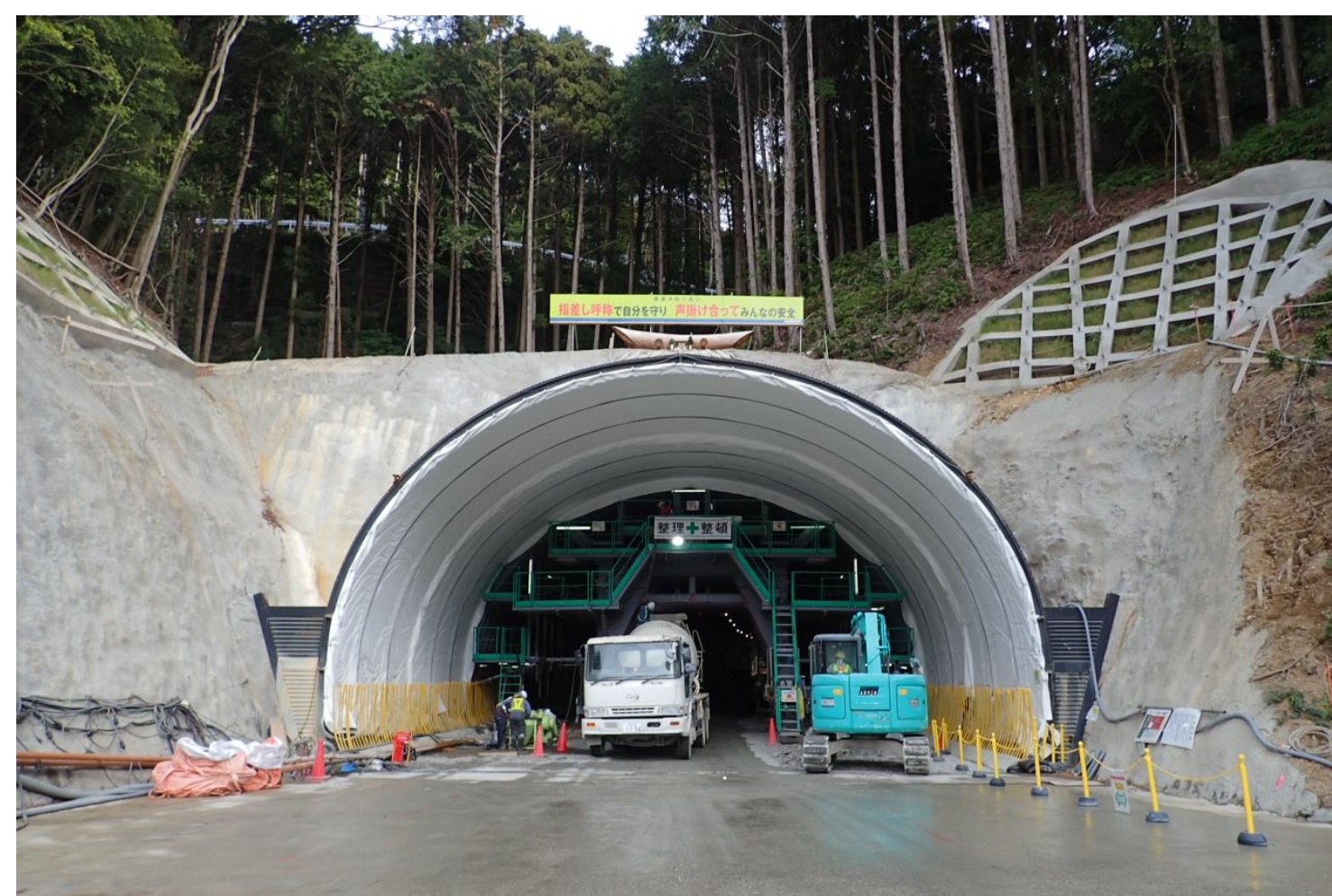
② 里野トンネル他工事(令和2年10月14日貫通)