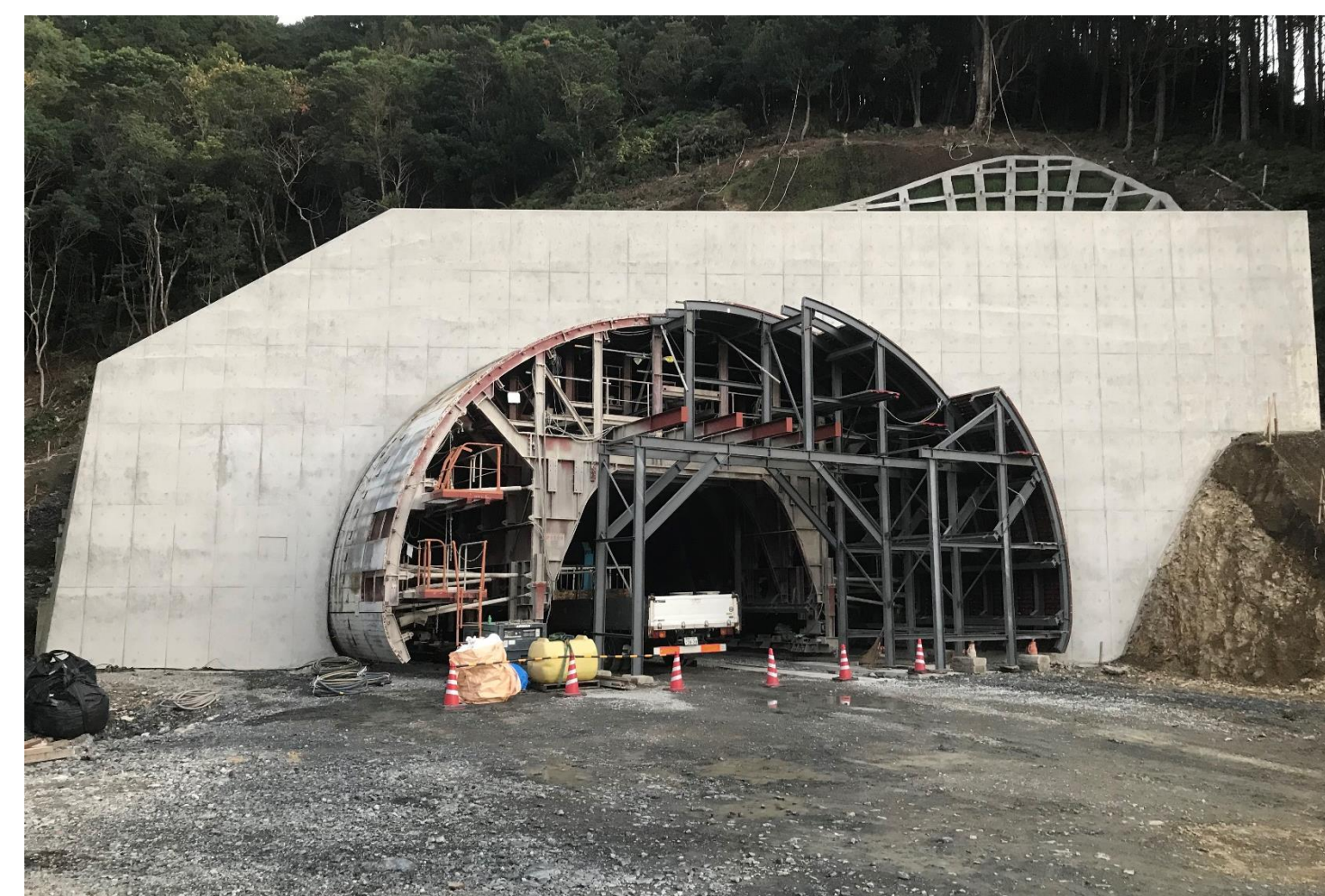
③ 雨嶋トンネル工事(令和2年4月7日貫通)