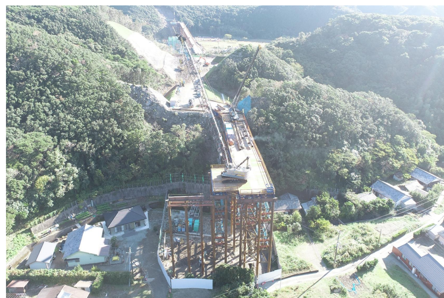
⑤ 釜郷原川橋進入路工事