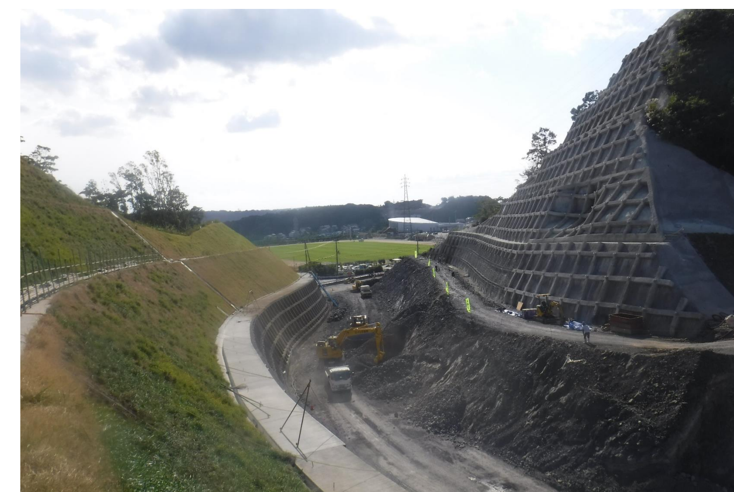
⑧ ICアクセス改良工事