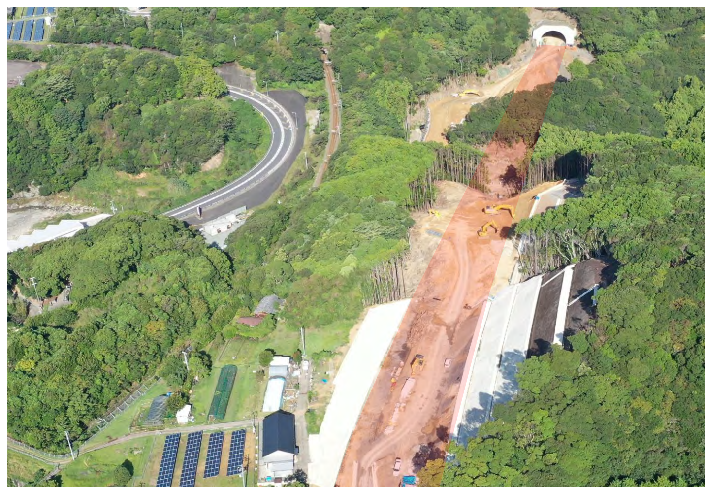
② 串本町和深(道路改築)