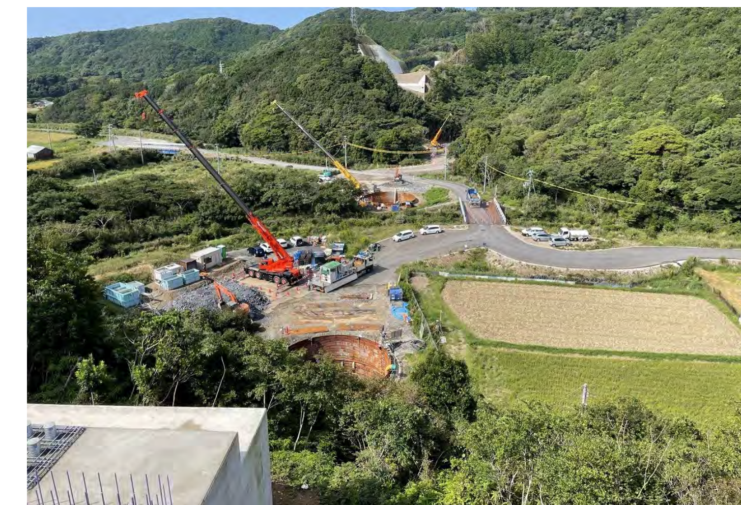
⑧ 串本町關野川(關野川橋)