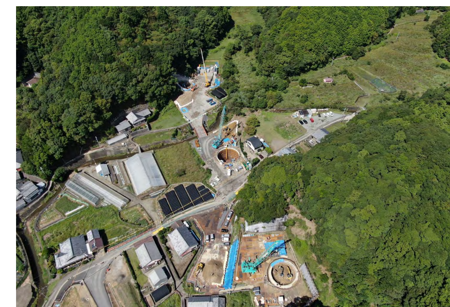
④ 串本町江田(江田川橋)