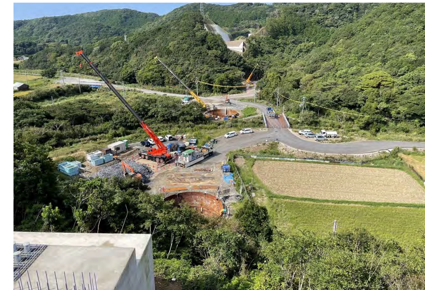
⑧ 串本町 （龍野川） （龍野川橋）