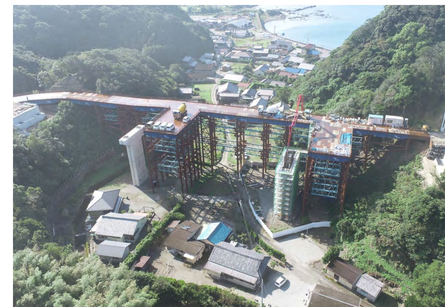
⑥ 串本町高富(釜郷原川橋)