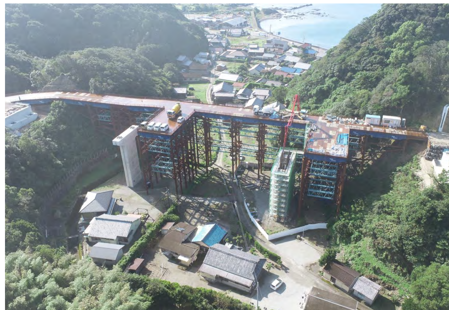
⑥ 串本町高富(釜郷原川橋)