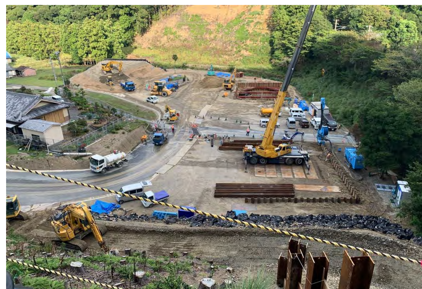
① すさみ町里野(里野西池川橋)