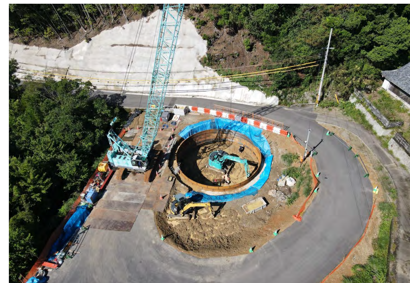
③ 串本町和深(熊谷川第二橋)