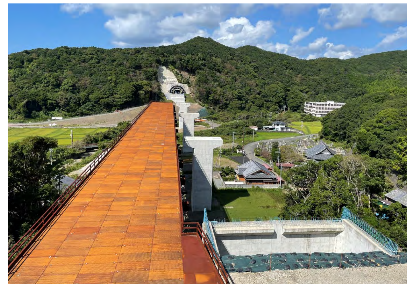
⑦ 串本町二色(二色川橋)