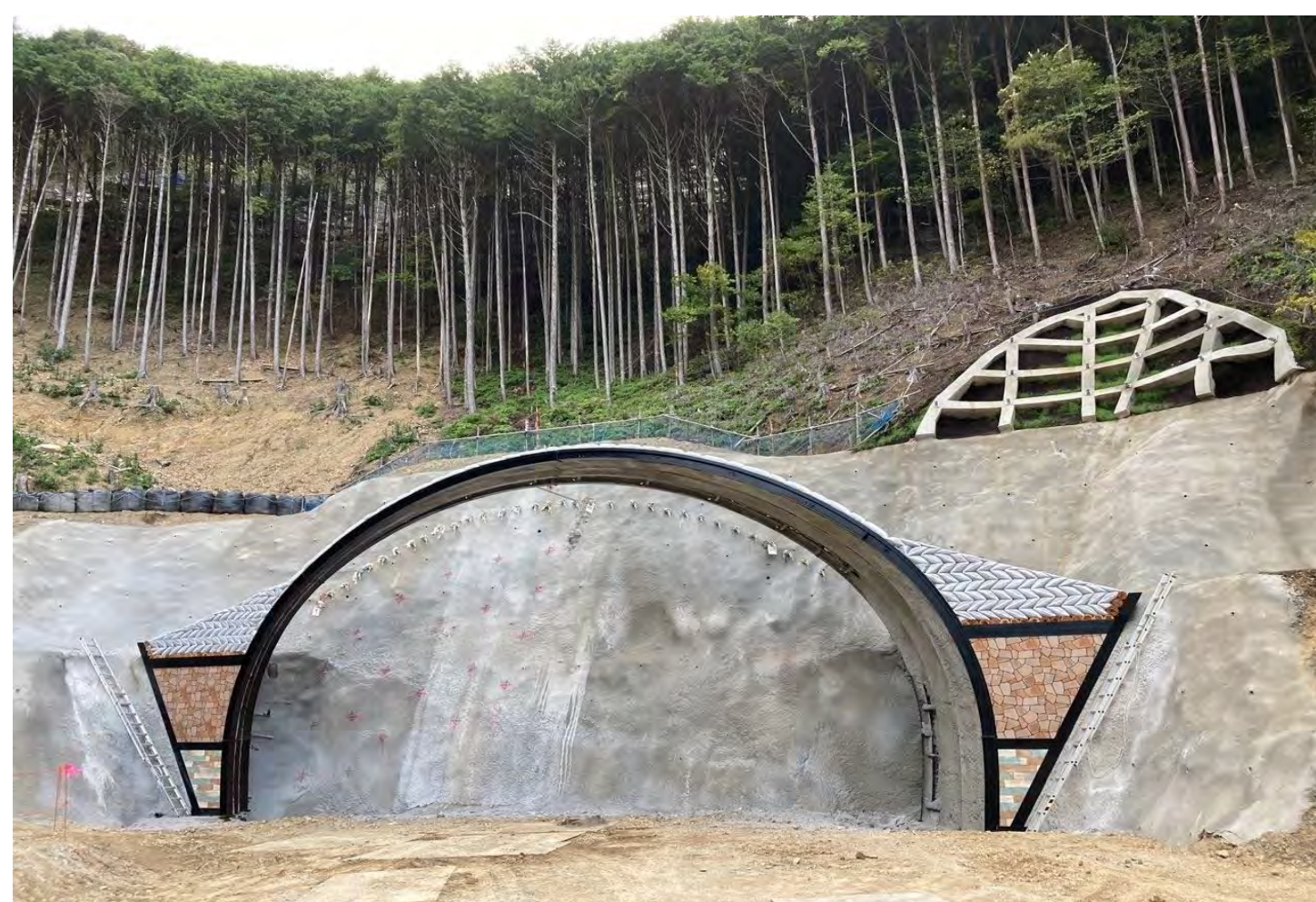
⑤ 串本町田並(田並トンネル)