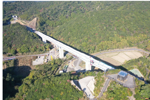
⑦串本町蘭野川(蘭野川橋)