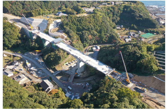
④串本町田子(田子川橋)