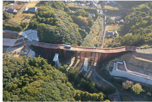
③串本町和深(安指川橋)