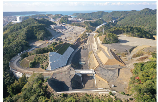
⑧串本IC仮称 (道路改良)