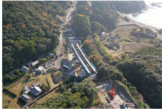
②すさみ町里野(小河瀬谷川橋)