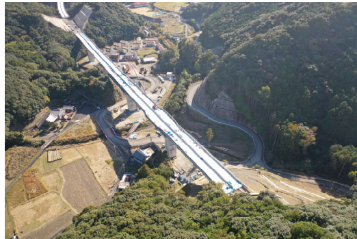
⑥串本町有田(有田川橋)