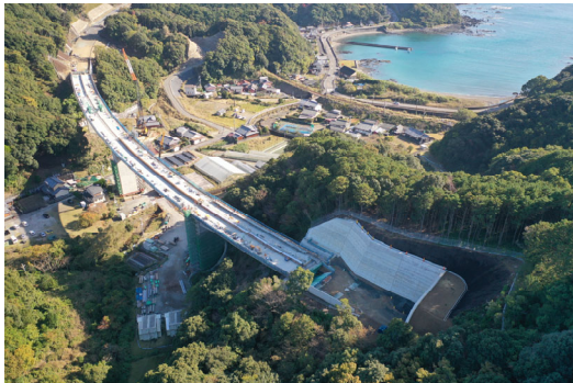
⑤串本町江田(江田川橋)