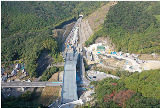
①すさみ町江住(江住川橋)