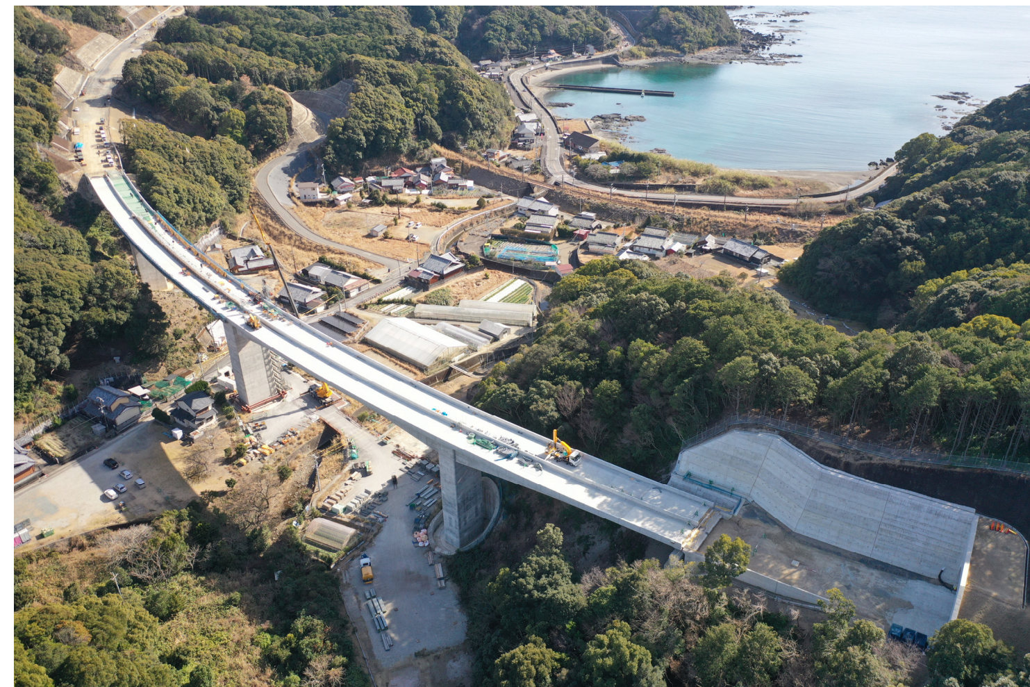
⑦串本町江田(江田川橋)