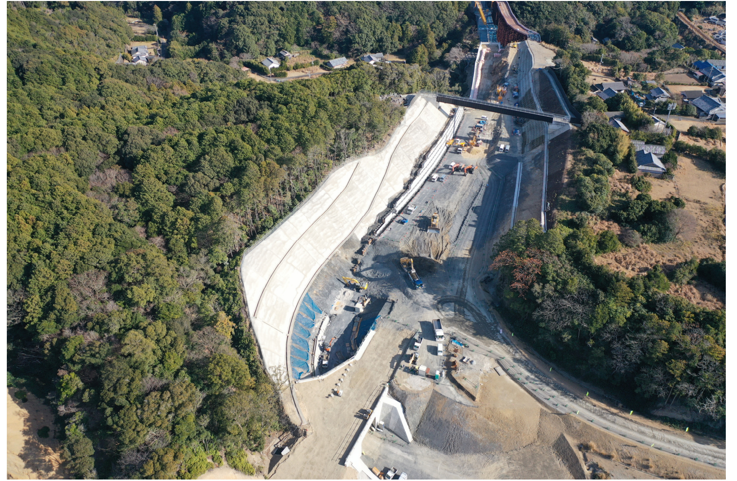
④和深IC仮称(道路改良)