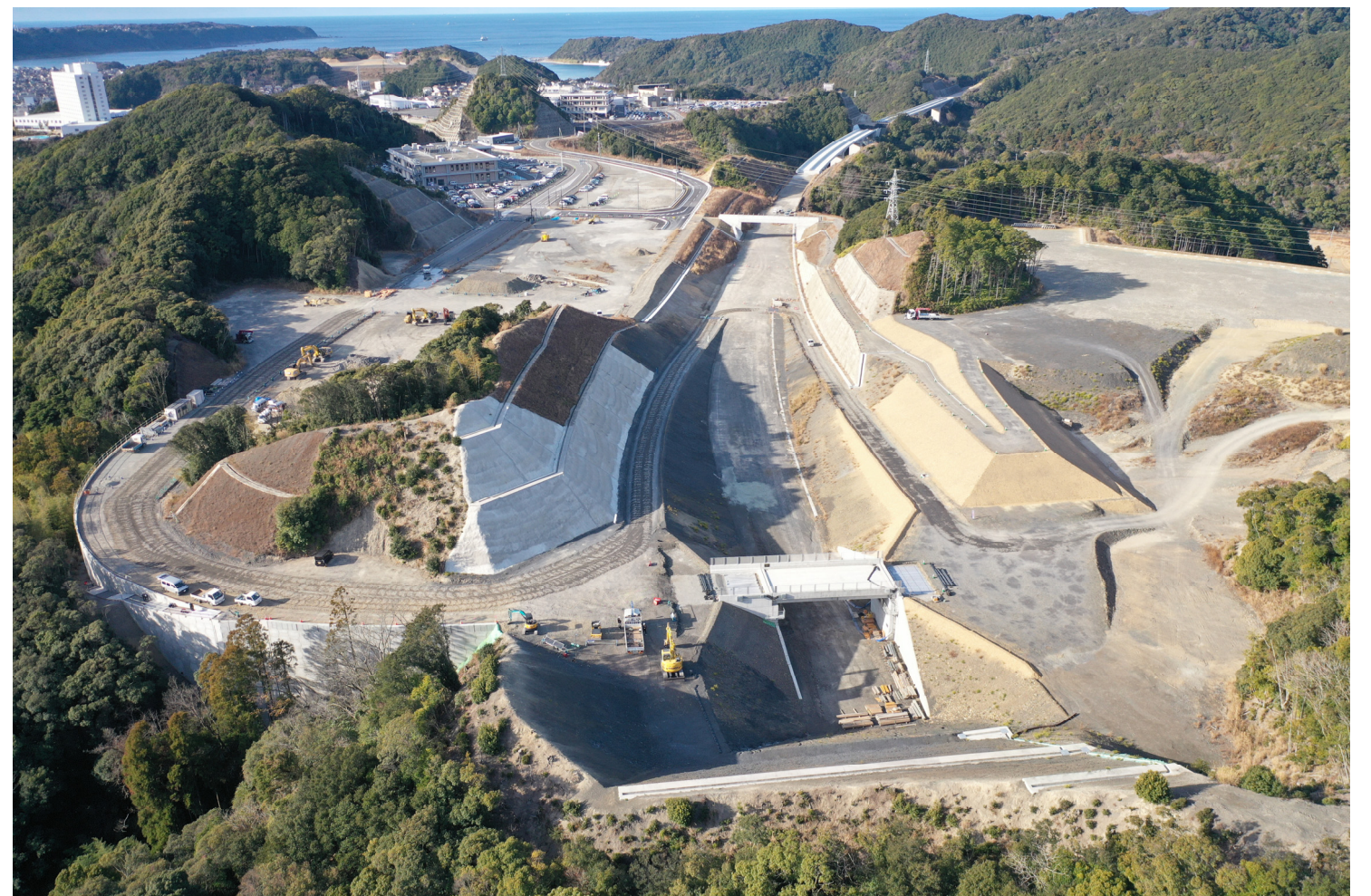
⑧串本IC仮称(道路改良)