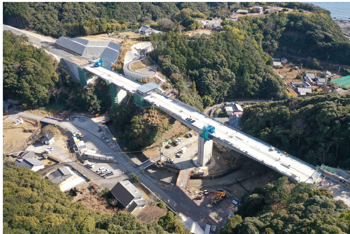
⑥串本町田子(田子川橋)