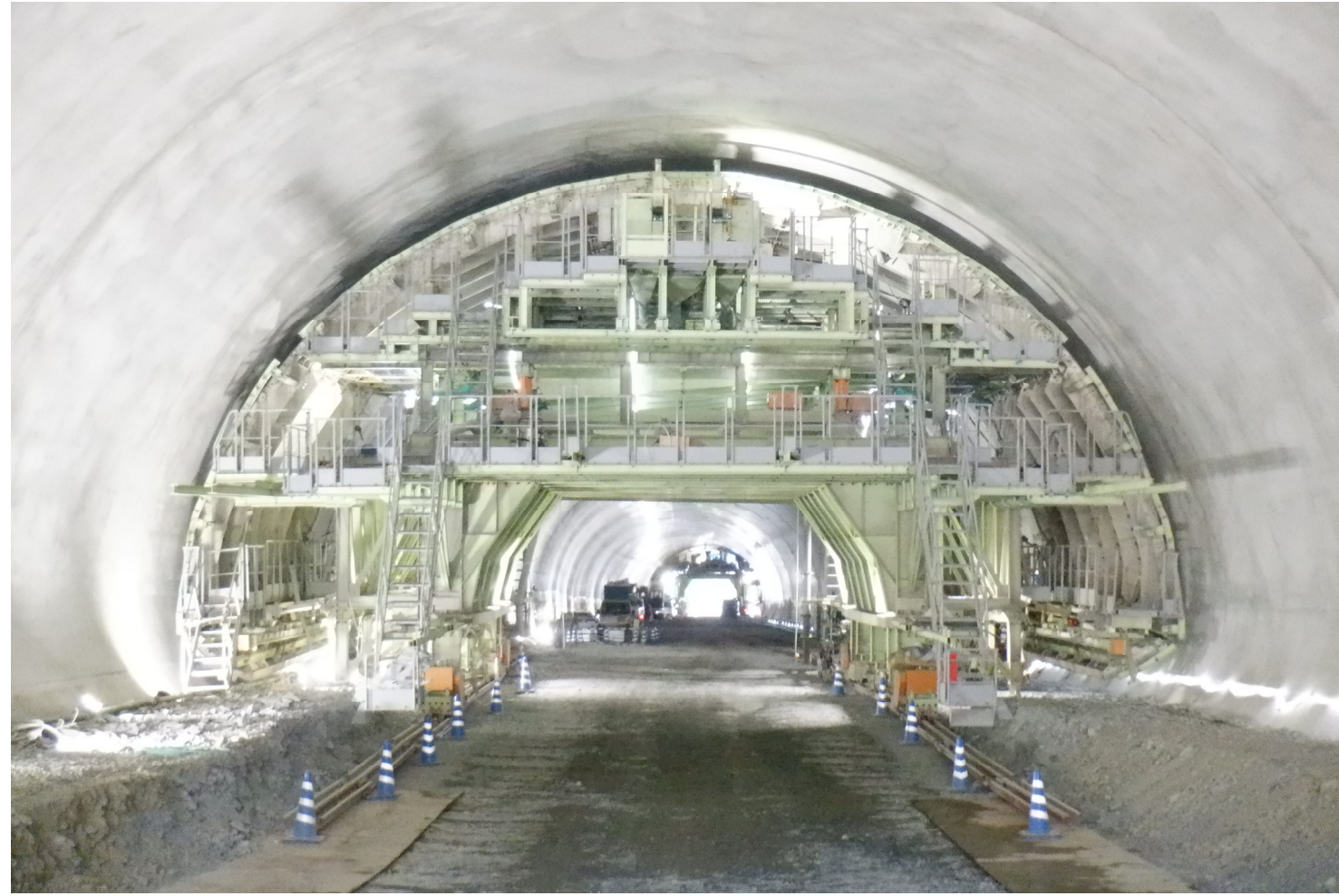
②すさみ町江住(江住第一トンネル)