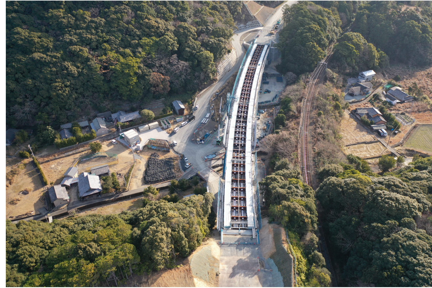
③すさみ町里野(小河瀬谷川橋)