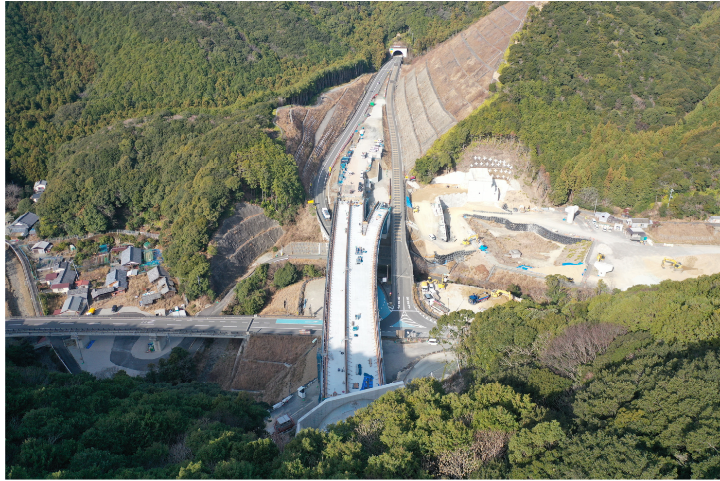
①すさみ町江住(江住川橋)