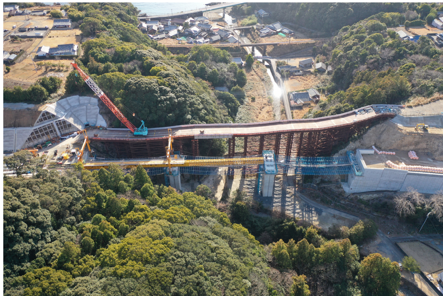
⑤串本町和深(安指川橋)