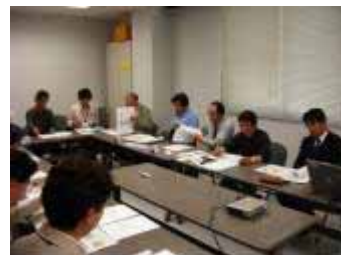
地域運営会議の様子

去る5月25日、シーニックバイウェイ紀南（仮称）の活動の中で最も重要であり、地域の活動団体の方々が連携や情報の共有を図る、『すさみ町地域運営会議』が、すさみ町役場会議室において開催されました。