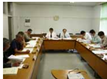
地域運営会議の様子

去る6月1日、シーニックバイウェイ紀南（仮称）の活動の中で最も重要であり、地域の活動団体の方々が連携や情報の共有を図る、『串本町地域運営会議』が、串本町役場委員会室において開催されました。