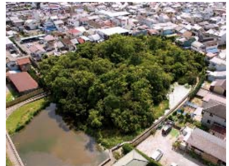
写真5 浮島の森

熊野川では流下能力の確保に向けた河道掘削が行われてきたが、河川整備事業における自然環境への影響は少なくない。河口干潟の保全とともに本川、相野谷川の生育・生息環境への配慮にも努めるなど、事業を進める上での自然環境への影響を極力与えないような施工方法等の検討が求められる。