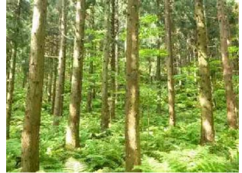
写真4 適切に整備（間伐）された森林

平成23年の紀伊半島大水害では多数の斜面崩壊、土砂流出が発生した。このような斜面崩壊等が発生した後は、草本群落へ遷移するためニホンジカ等の増加により地表面が攪乱され土砂流出が促される可能性が高い。また、獣害による森林の荒廃もみられ、熊野川への土砂流出が更に活発になることが懸念され、森林管理の問題は山間部だけにとどまらず河道にも係わってくる問題である。