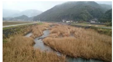
写真 9 相野谷川の土砂堆積の状況

相野谷川では堆砂の影響で河床が高くなり、ツルヨシ等が繁茂している。河道掘削により一時的な改善は見られたが、すぐに再堆積が起これ、河床が高くなっている。また、ツルヨシ等の繁茂により、河川を利用できるよう設置した施設が使いえなくなることもあり、河川利用者に配慮した維持管理が必要である。