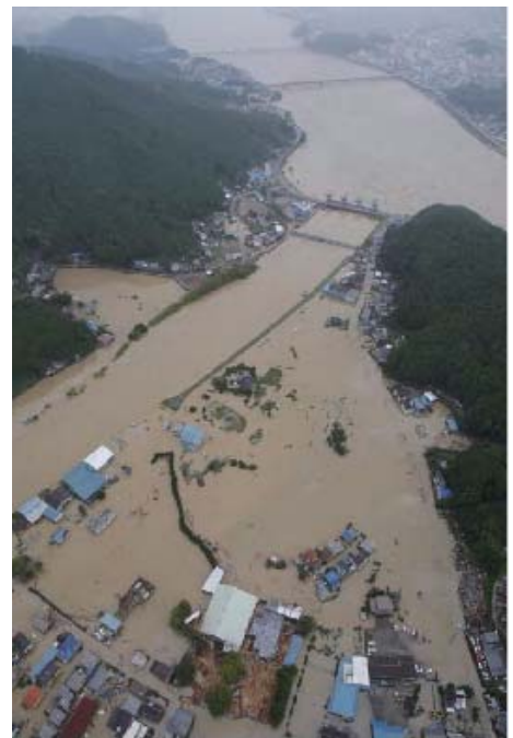
写真1 平成23年9月洪水（紀伊半島大水害）の状況（紀宝町鮎田地区）

また、熊野川流域には歴史的に貴重な史跡や優れた景観を示す国の特別名勝等が多く存在するが、これらについても被災しており、熊野速玉大社では御旅所の流出、新宮城趾では石垣の崩壊、国の特別名勝・天然記念物である瀨峡では河道内の土砂堆積により舟運の運行が休止される等の被害が発生した。