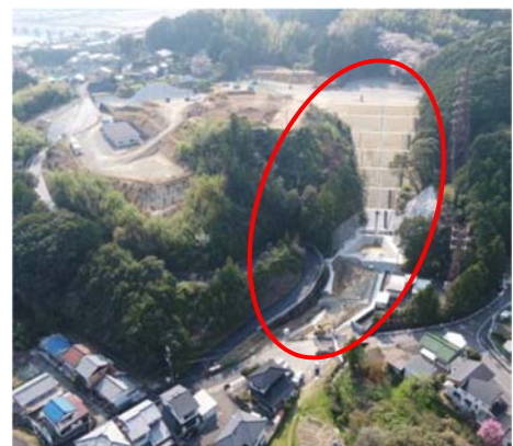
写真 7 津波避難場所 (紀宝町成川地区)