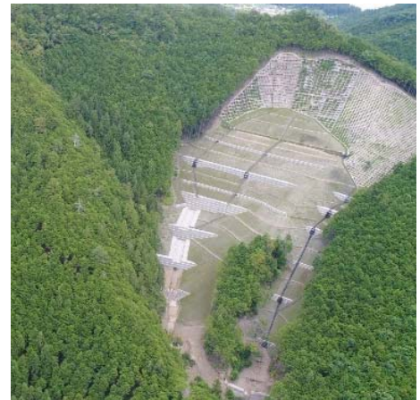
写真2 治山事業による土砂流出抑制

総合土砂管理上の問題は土砂流出現象により発生するので、局地的な対策では十分でなく、流域内の関係者が連携した対策が重要である。熊野川流域では、森林管理者、河川管理者、ダム管理者、市町村等からなる「熊野川の総合的な治水対策協議会」（平成24年7月設立）、またあらゆる関係者の参画、協働を目指した「熊野川流域治水協議会」（令和2年8月設立）がすでに設置されている。今後もこれらの協議