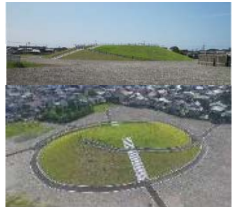
写真 6 津波避難場所 (新宮市宮井戸地区)

防災・水害対策を進めて行く上では、過去の災害についての記録や調査、地名等も加味して検討を行い、住民にもPRしていくとともに周知することが重要である。