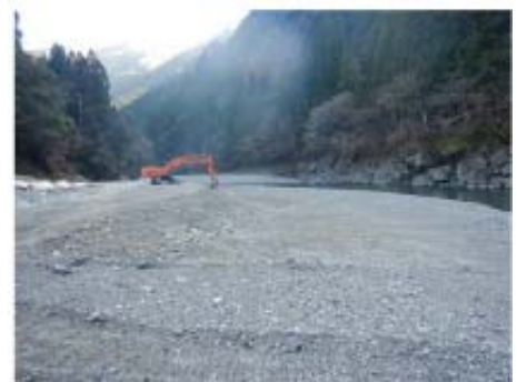
写真3 ダムの堆積土砂掘削状況