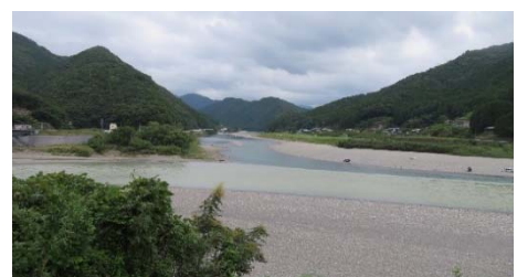
写真 8 熊野川の濁水の状況

平成23年紀伊半島大水害以降、濁水はそれ以前と比べ悪化していたが、国、三重県、奈良県及び和歌山県による流域での治山、砂防事業の進捗及び、ダム管理者による選択取水設備の改良や濁水早期放流操作といった濁水長期化軽減対策により、濁度は低減傾向にある。