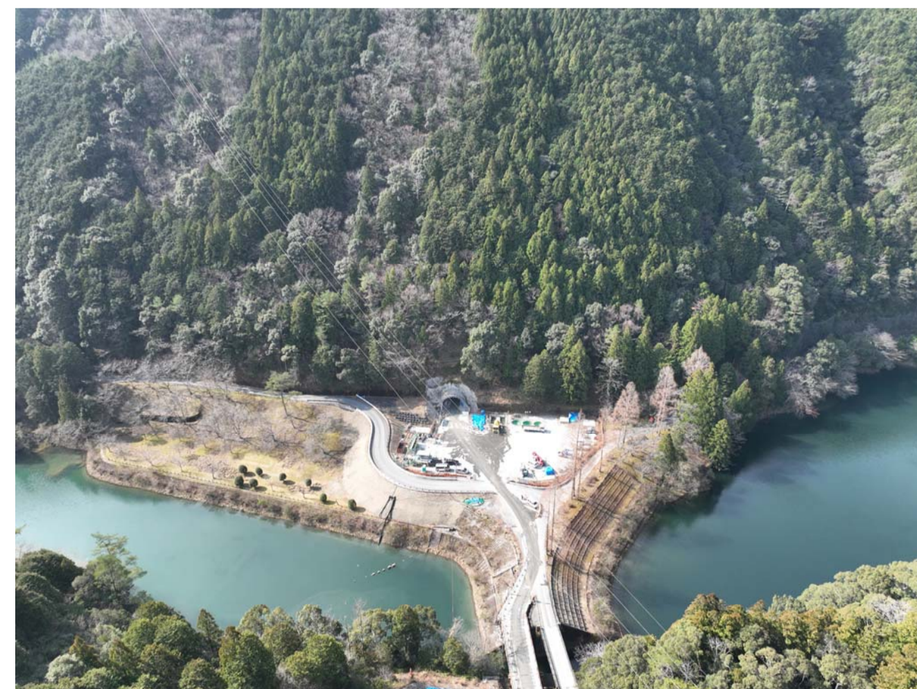
⑥ 熊野市紀和町小森(2号橋・2号トンネル)