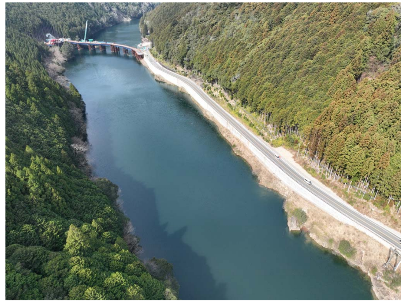
① 北山村下尾井(道路改良)