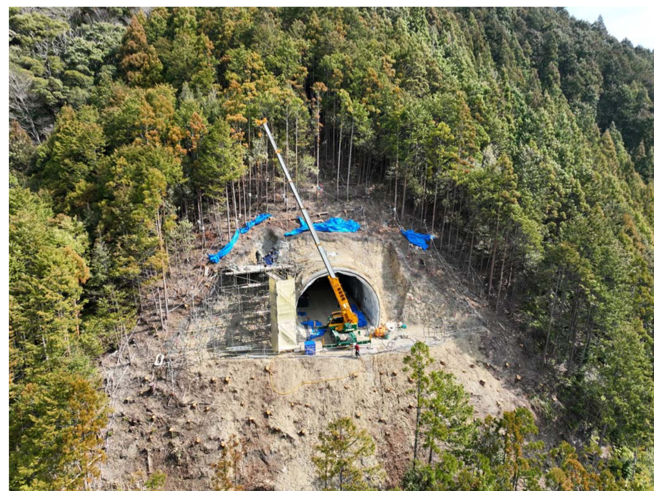
⑦ 熊野市紀和町小森(2号トンネル)