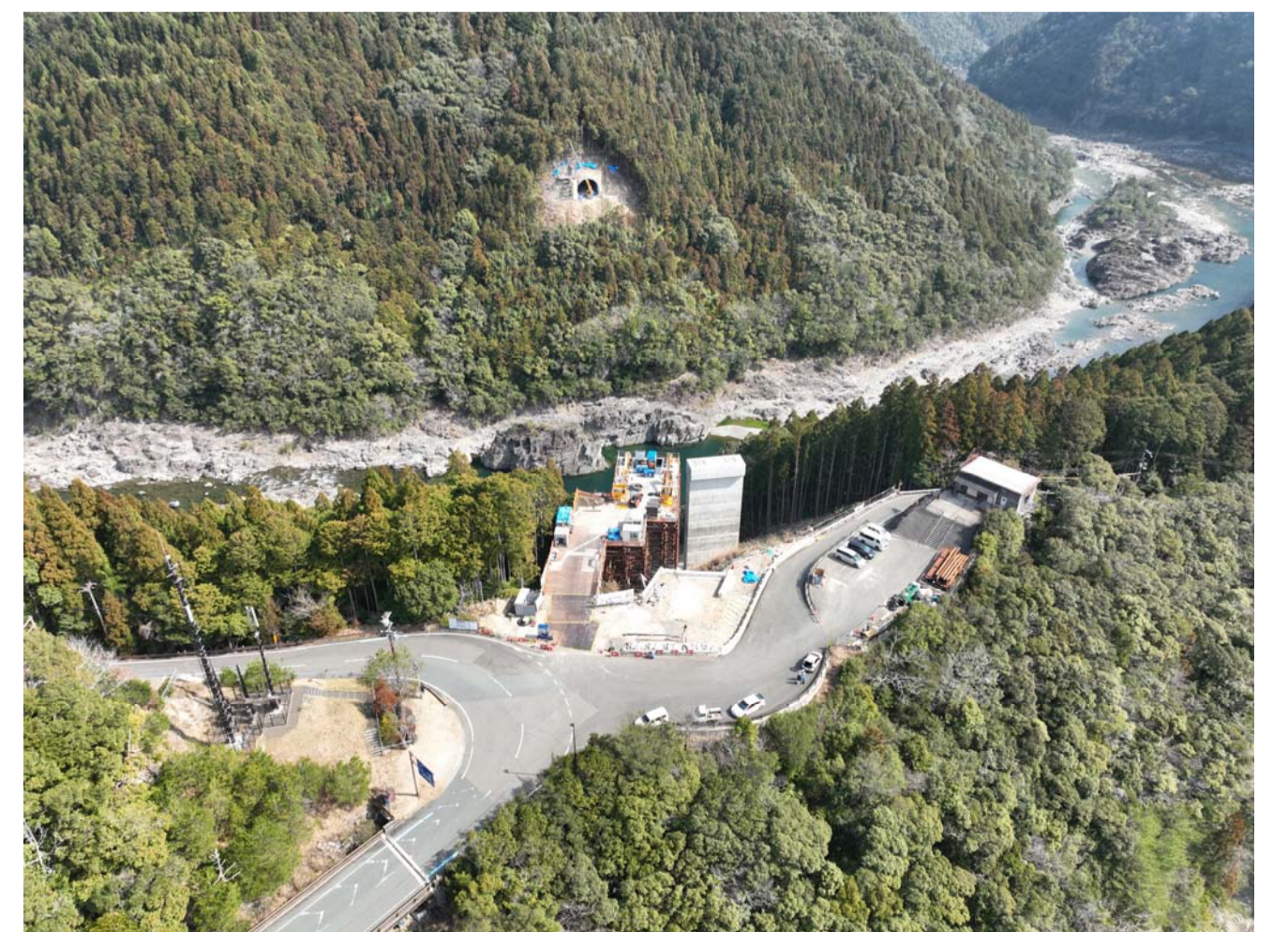
⑧ 北山村小松(3号橋AA2橋脚)