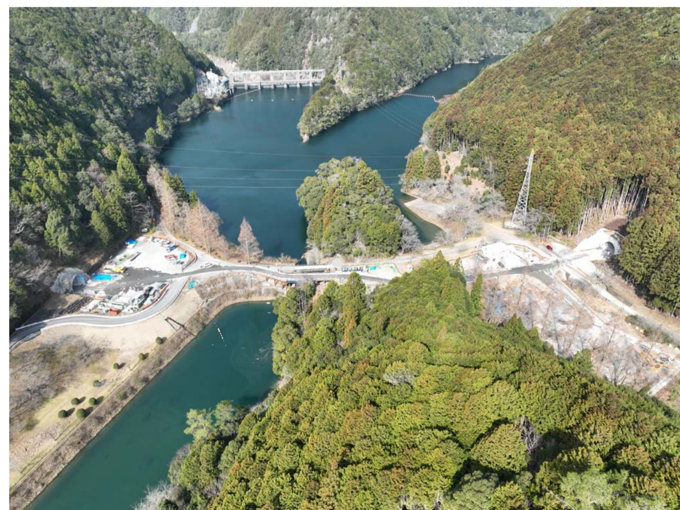
⑤ 熊野市紀和町小森 (1号トンネル・2号橋・2号トンネル)