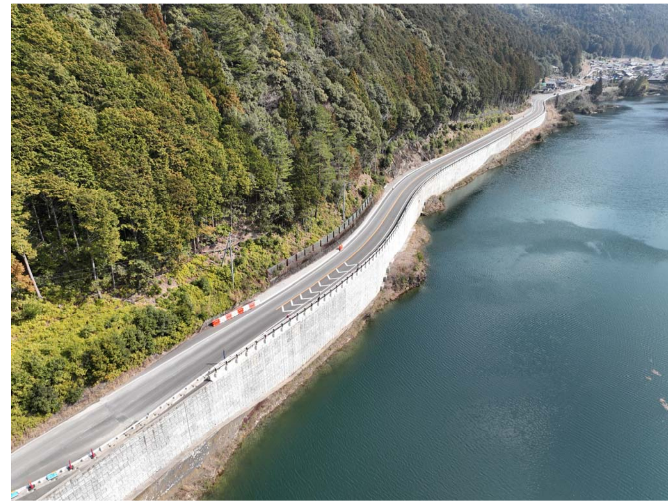
② 北山村下尾井(道路改良)