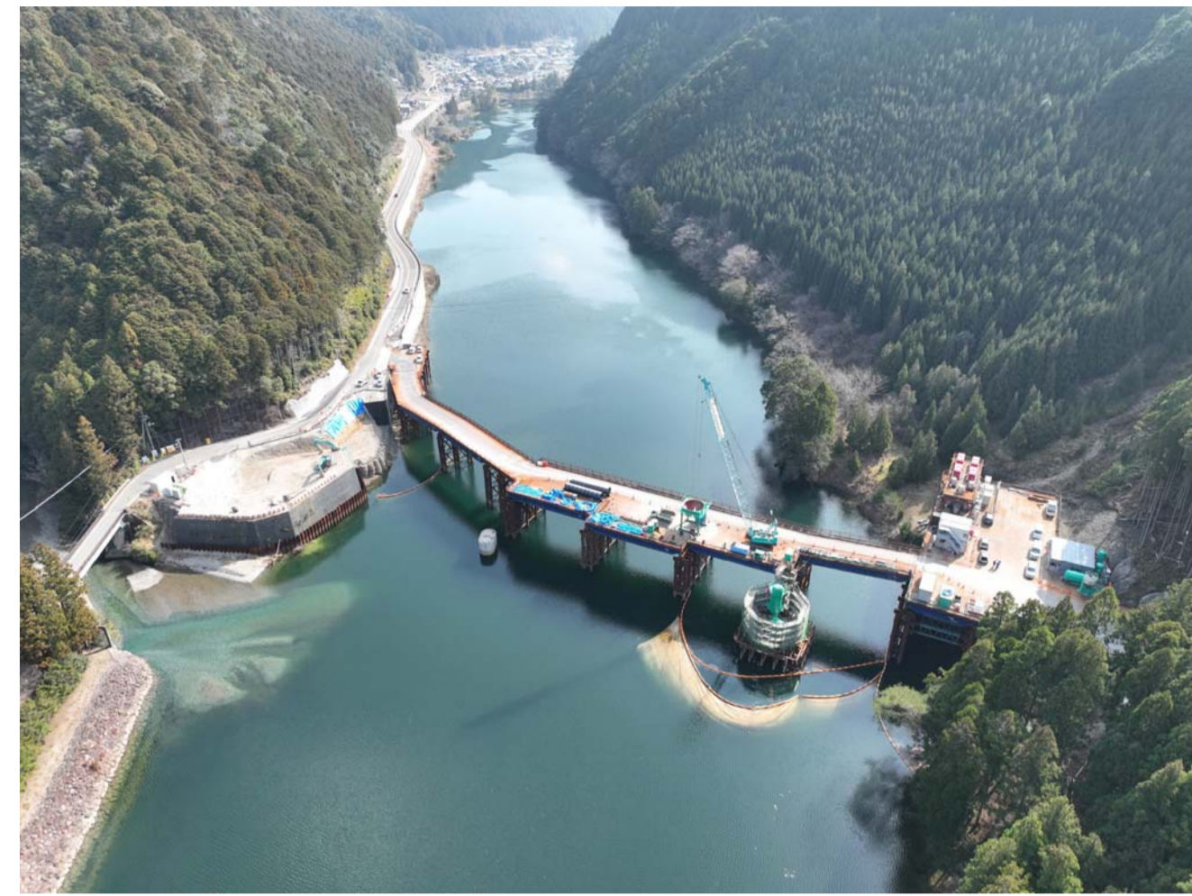
③ 北山村下尾井(1号橋・1号トンネル)