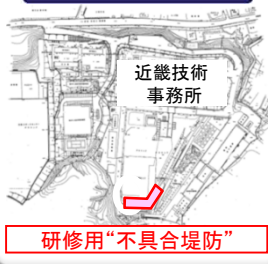
研修用堤防 位置図

【日本初！】 経験の浅い職員でも、堤防や護岸の不具合を実際に見て・触れて・理解を深めることを目的に、近畿技術事務所内に研修用堤防として実物大の“不具合堤防”を整備した。(平成27年3月完成)