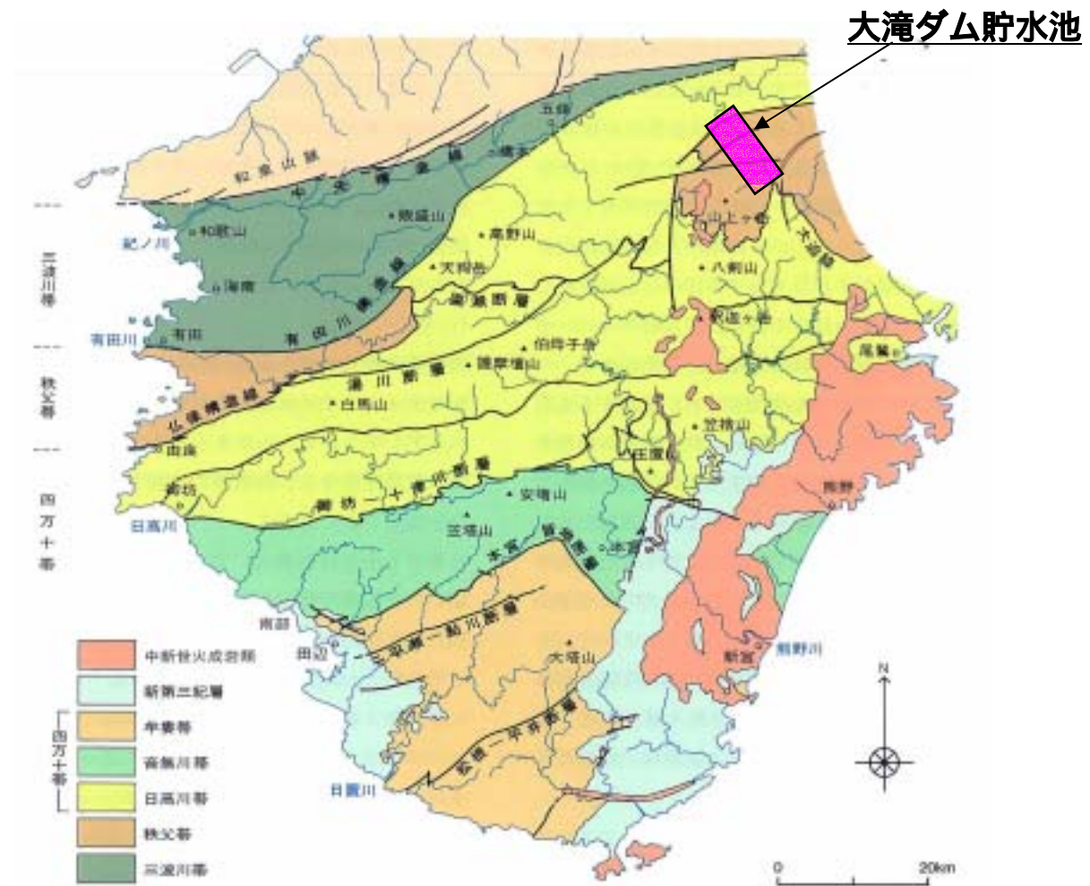
図 .3.3 紀伊半島の地帯区分 (URBANKUBOTA NO.38, 1999)