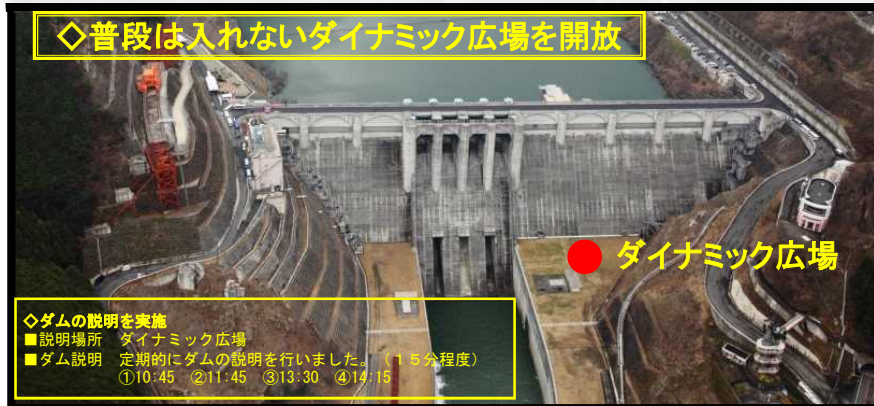
●ダイナミック広場