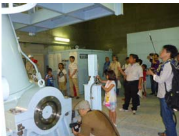
上段コンジットゲート室

当日は、「大滝ダム堤体」の普段入れないコンジットゲート室やダイナミック広場において、ダムの役割や仕組み等の説明を行いながら見学をしていただきました。また、「大滝ダム・学べる防災ステーション」では、映像や模型を見たり、過去に起った豪雨を体験していただきました。