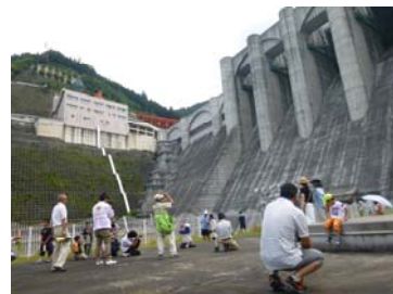
ダイナミック広場