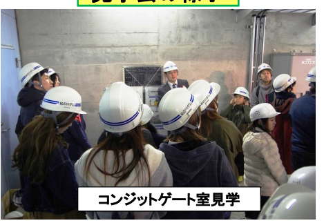
コンジットゲート室見学