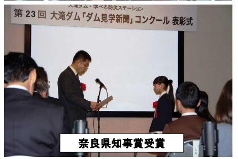
奈良県知事賞受賞