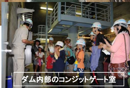
ダム内部のコンジットゲート室