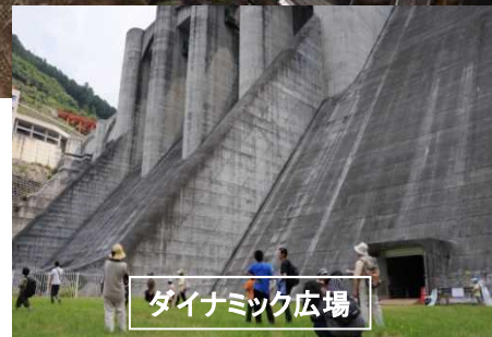
ダイナミック広場

大滝ダムでは、8月3日に「大滝ダム体験ツアーin2019」を開催します。ダムの大きさや森と湖の自然に親しんでもらいながら、大滝ダムの役割や洪水の防災意識を学んでもらうため「特別見学会」を開催します。