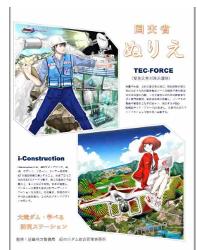
国土交通省ぬりえ