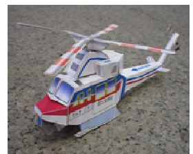
国土交通省ペーパークラフト

ダム見学新聞コンクールは、平成8年度から始まり、令和2年度で25回目の開催となります。