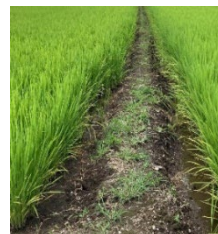
畦畔が痩せ 容易に雨水が流出