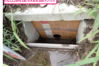
流出調整板設置の例