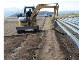
畦畔の再構築を支援