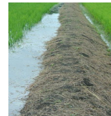
堅牢な畦畔により 雨水を安全に貯留