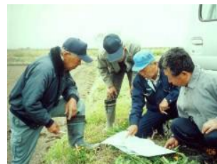
水利用・土地利用等の 調査・調整活動を支援