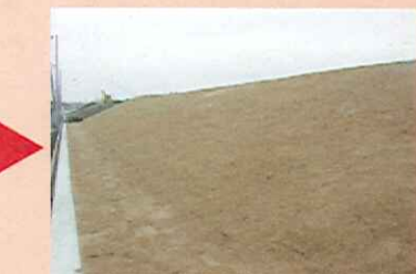
カゴマットを土で覆い芝を張って完成です。