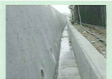
ドレーンの排水及び堤防表面からの表流水を集水します。