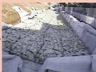
カゴマット設置後の状況