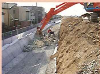
並べた石を固定するため、石の上にかゴマットを置き、中にもりとなる石を入れます。(カゴマット工)