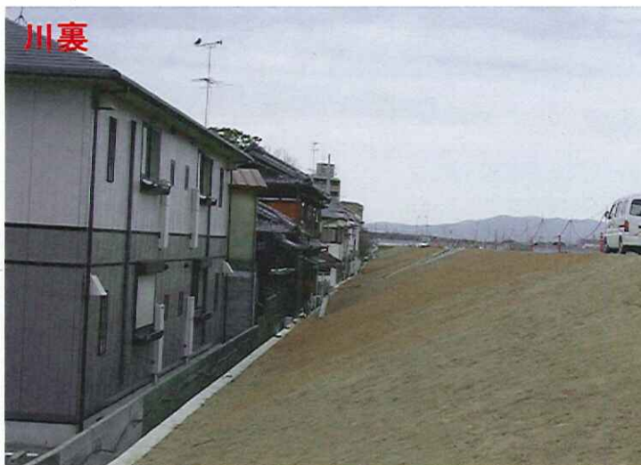
↑ 施工後(ドレーン工設置後の様子)