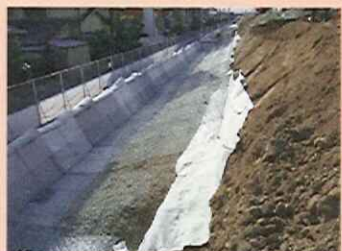
堤防内の水通しを良くするため、石などの水を良く通す材料を並べます。(ドレーン工)

ドレーン・カゴマット工 浸透水を速やかに排水するために、裏のり尻にドレーン・カゴマット工を設置します。