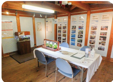
令和4年8月5日(金)～8月17日(水) 名張市旧細川邸やなせ宿