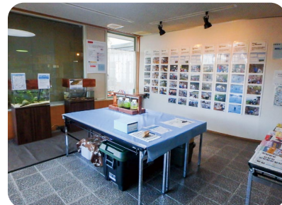
令和4年8月18日(木)～8月31日(水) 名張市立図書館