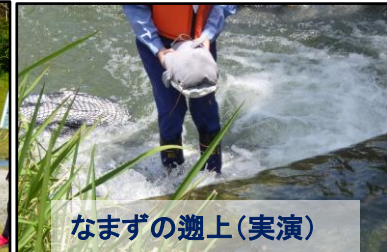
なまズの遡上(実演)