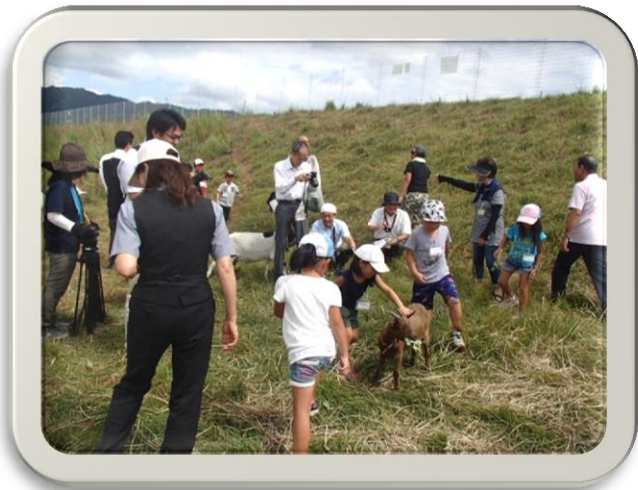
ヤギとふれあう児童