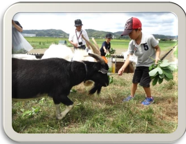
大好物のクズの葉でヤギを誘き寄せる児童