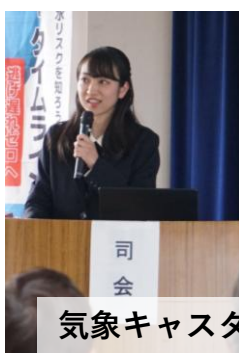
気象キャスターによる解説