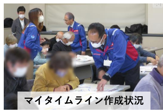
マイタイムライン作成状況