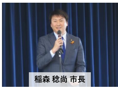
稲森 稔尚 市長