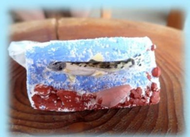
ぬり絵が完成したら本物と比べてみよう