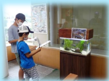
はじめに本物をよく観察しましょう