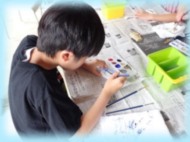
せっこうのモデルに色をぬります