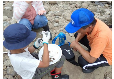
ガーネット採集のようす②