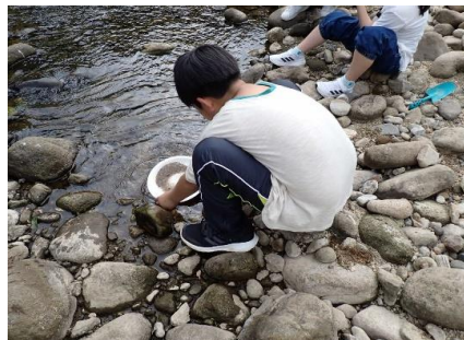
ガーネット採集のようす③