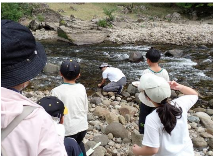
ガーネット採集方法の説明②