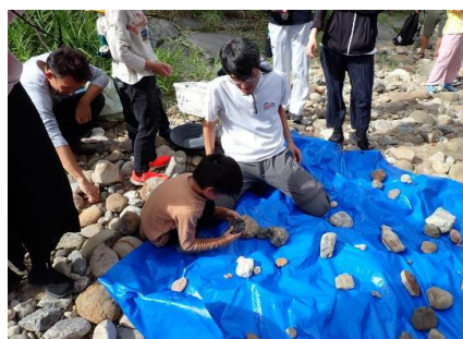
岩石収集のようす