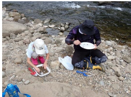
ガーネット採集のようす①