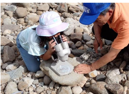
実体顕微鏡での観察のようす