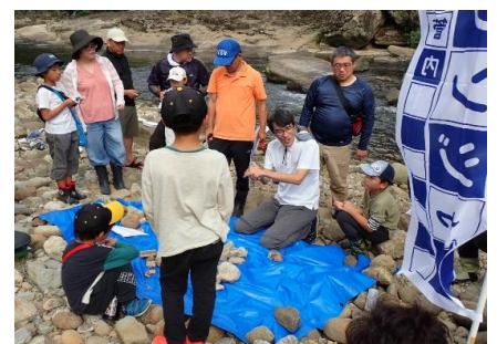
岩石の説明・観察