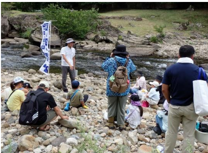
ガーネット採集方法の説明①