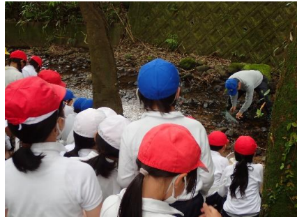
採集方法説明のようす