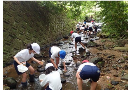
いきもの採集のようす①