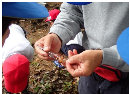
いきもの採集のようす③