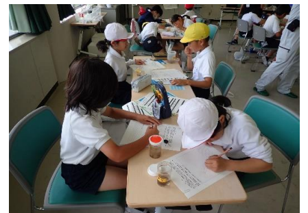
観察・記録のようす①