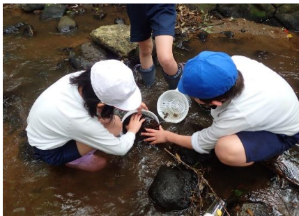
いきもの採集のようす②