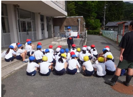
オリエンテーリングのようす