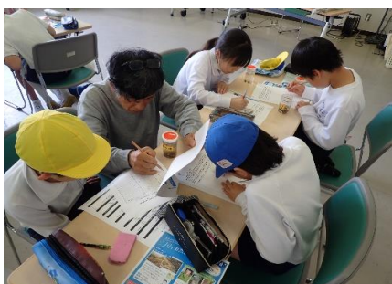
観察・記録のようす②