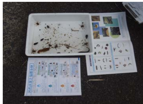
ビオトープ生物観察