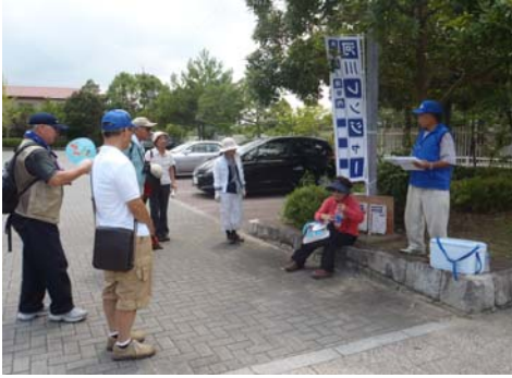
注意事項等の説明