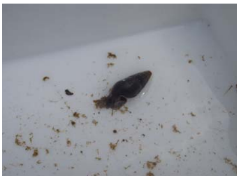
ビオトープ生物観察(カワニナ)