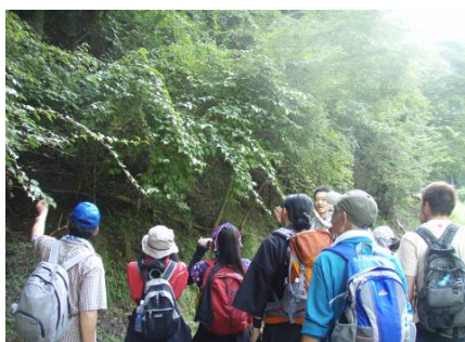
薬草観察のようす ②