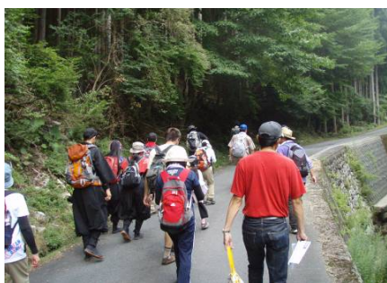
源流探検のようす ①