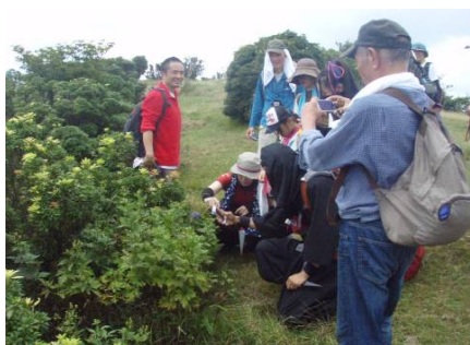
薬草観察のようす ④