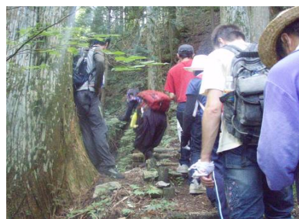
源流探検のようす ③