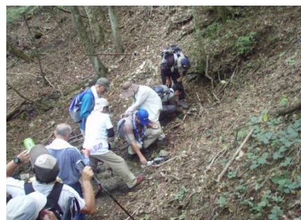
名張川源流に到着