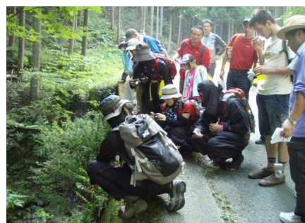
薬草観察のようす ③