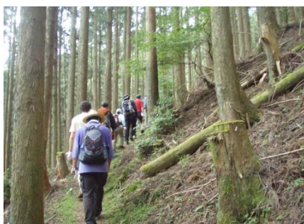
源流探検のようす ②