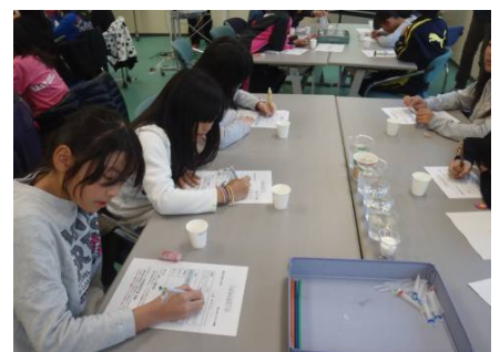
水質調査のようす ④