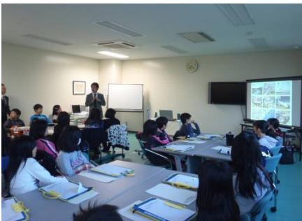
上野遊水地・樋門などの説明