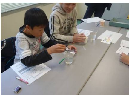
水質調査のようす ②