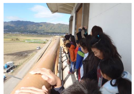
小田陸閘から遊水地を見学