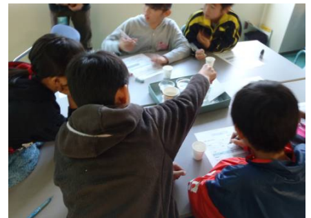
水質調査のようす ①