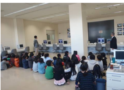
監視操作室の見学